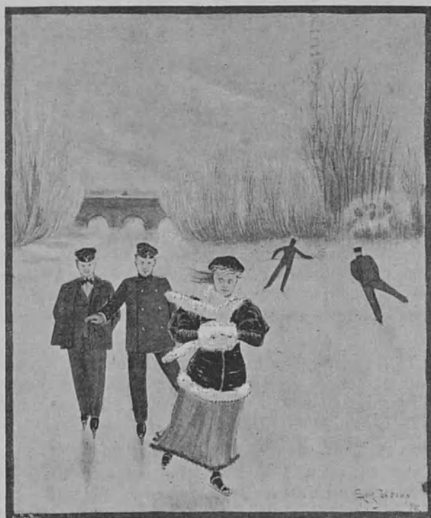
PÅ ISEN. Originalteckning för Sport.