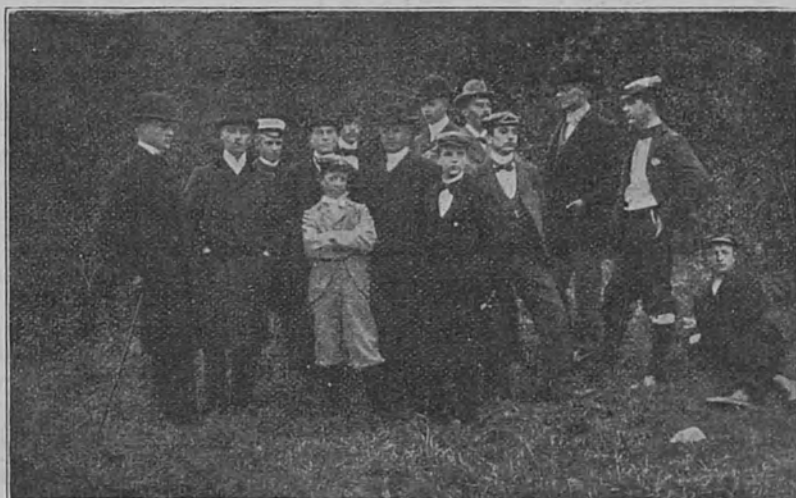
Ett stycke af Centralkretsen

samladt å Ladugårdsgärdet till gångtåflan. Dagens hjälte, Bisse, ligger utsträckt å la koling efter sin seger öfver »Fellow», som inte hann med, för det gick för fort.