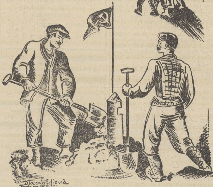
Dail. D. TARABILDINĖS piešinys