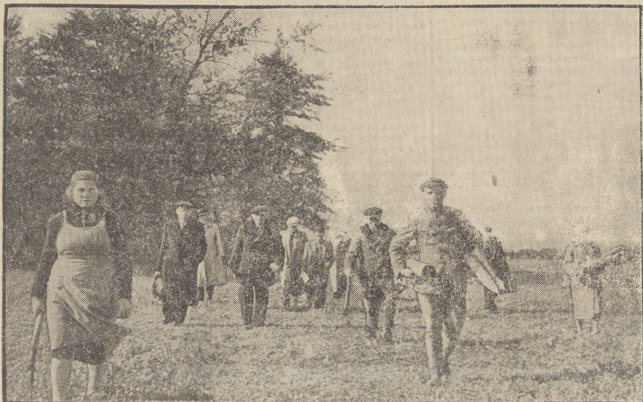
Bežemiai, mažžemiai ir Vilkaviškio apskr. ž. ūkio kom. nariai ir kt. žengia skirstomos žemės plote, Gudelių km., Vilkaviškio valsčiuje. Pirmieji eina žemės gaunantieji: Narkeliūnienė, Jasaitis, Teškinė ir kt.

Žemės gauna tie, kurie ją ilgus metus dirbo