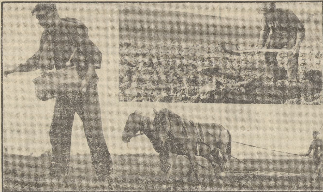
Paskutiniai žiemkenčių sėjos darbai Jezno apylinkėje, Alytaus apskr. Sėja pusėtinai sukludė nuolatini lietūs. Daug kur vandeniu nuleisti reikėjo prakasti griovelius.