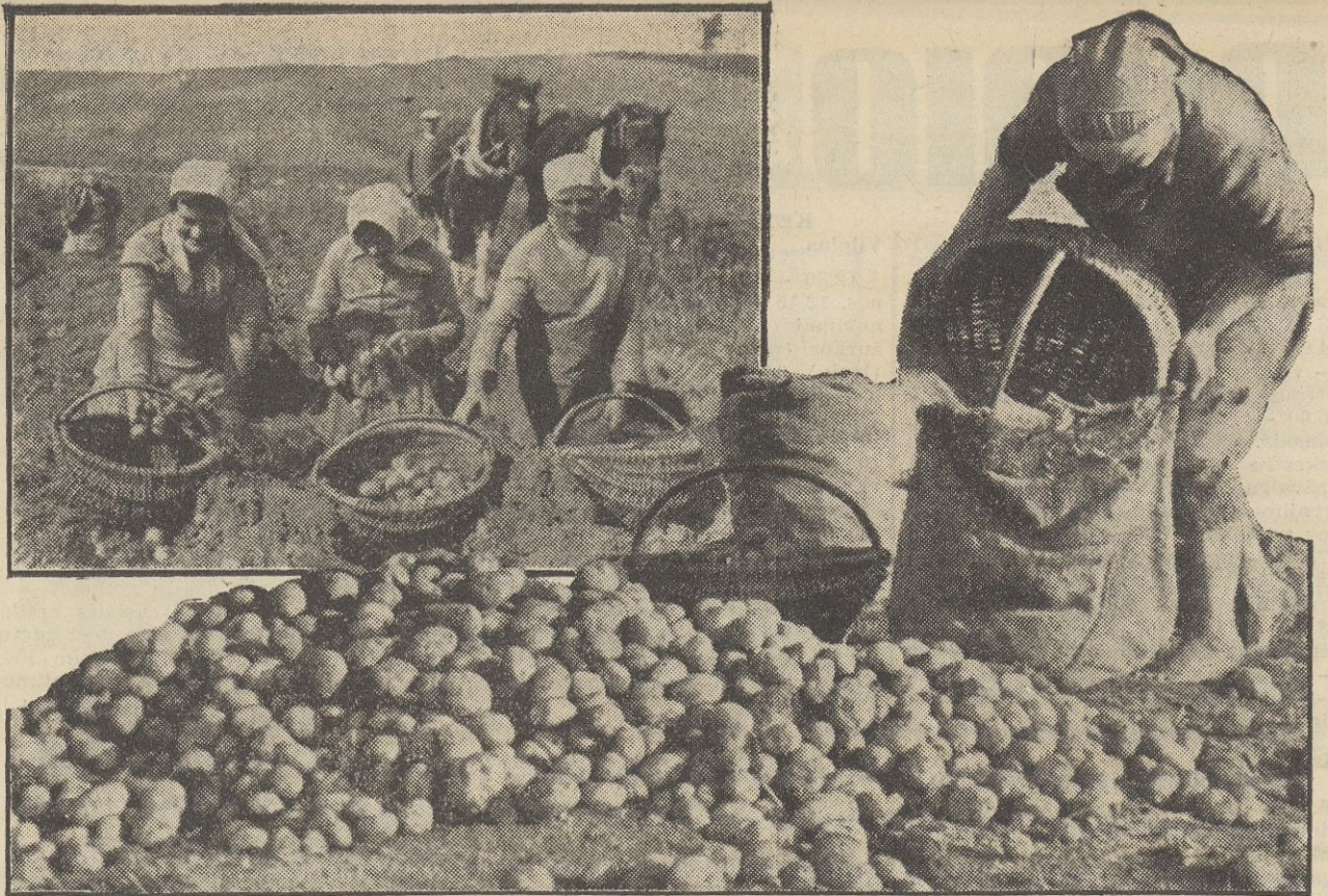
Tarybų Lietuvos laukuose pats bulviakasis

Sudarant sąrašus, organizacijos prašomos žiūrėti, kad koncentruotus pašarus nueitų ten, kur jie būtina reikalingi, ir prižiūrėti, kad jais nevyktų bet kokia spekuliacija.