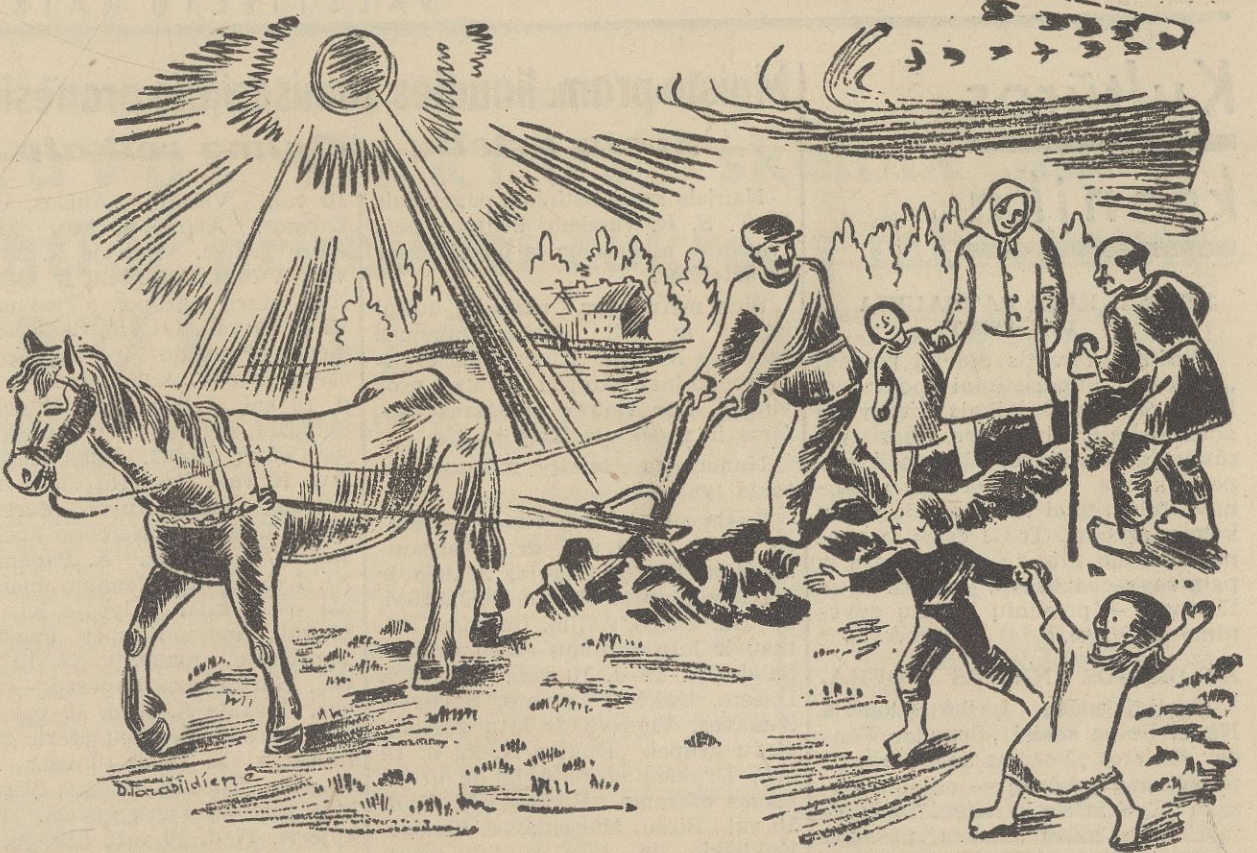
Naujo gyvenimo vaga

Visi LTSR piliečiai, turį kokius nors eksponatus arba dokumentus, galinčius įrodyti kovotojų kančias, prašomi prisiųsti turimą medžiagą į LLP S-gos būstinę, Kaunas, Stalino pr. 31b, su smulkiais aprašymais.