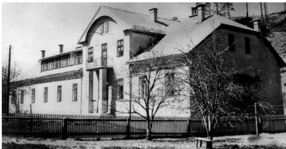
Bolnica Kranjske industrijske družbe, hrani GMJ

V prvo nadstropje se je prišlo skozi zadnji vhod in po ozkem, kamnitem stopnišču. Tam je bil vhod v naše stanovanje. Najprej se je prišlo v veliko in dolgo vežo. Desno od nje je bila jedilnica z balkonom, naprej pa manjša družinska jedilnica in kabinet. Na levi strani hodnika sta bila kopalnica in WC. Stopnišče je bilo od ostalih prostorov ločeno s stekleno steno. Na levi strani je bila kuhinja z zidanim štedilnikom in lijakom z mrzlo vodo. Na sredi kuhinje je stala miza s stoli. Naprej je bila shramba. Tam smo imeli tudi prvi hladilnik na izhlapevanje. Ob shrambi je bila majhna kamrica, kjer je bilo vedno toplo. Tam smo sušili perilo. Velika spalnica za starše ter moja in bratova soba pa so bile v mansardi.