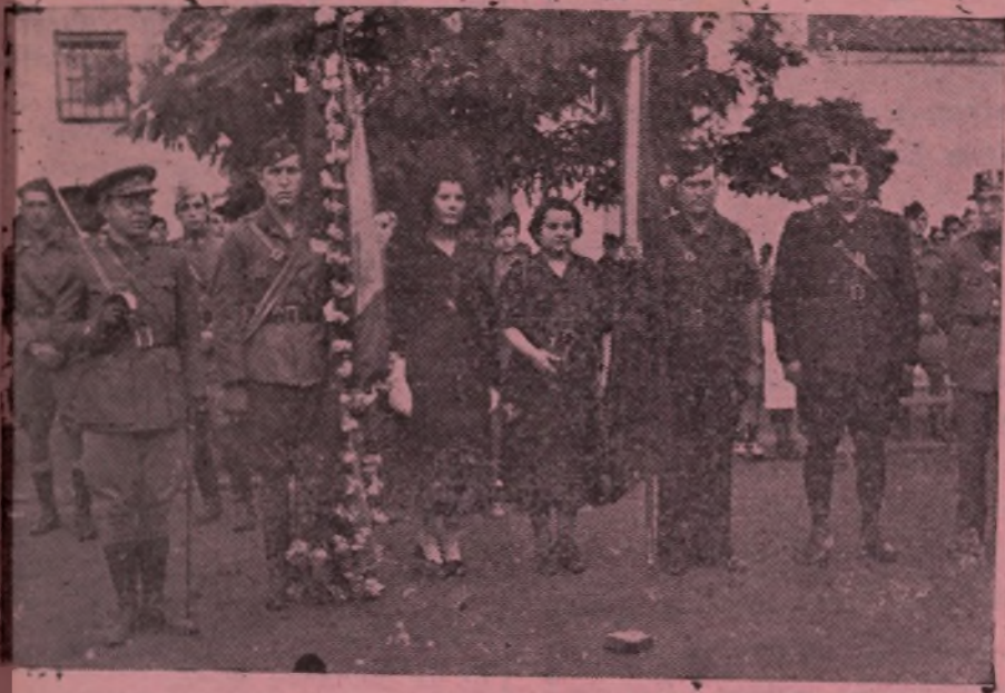
LA BENDICION DE LA BANDERA EN VILAFRANCA. LAS FUERZAS DESFILAN ANTE LA INSIGNIA DE LA PATRIA. LA MADRINA DE LA BANDERA JUNTO A LA ENSEÑA; LAS AUTORIDADES Y LOS JEFES

metralladoras, fusiles ametralladores, y secciones de Infanteria y de Artilleria.