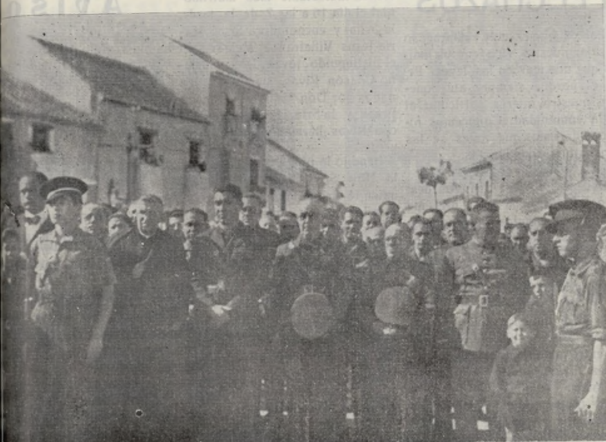
Presidencia del acto celebrado el día 29 de Octubre ante la Cruz de los Caidos