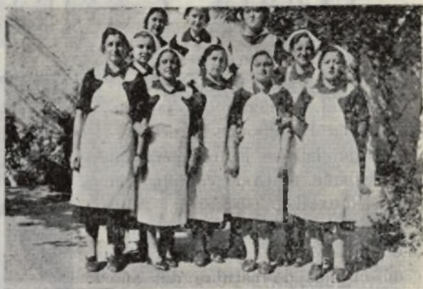
Grupo de bellas falangistas con el uniforme de servicio