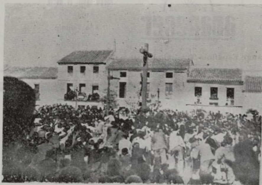
Aspecto general del acto en la Cruz de los Caídos