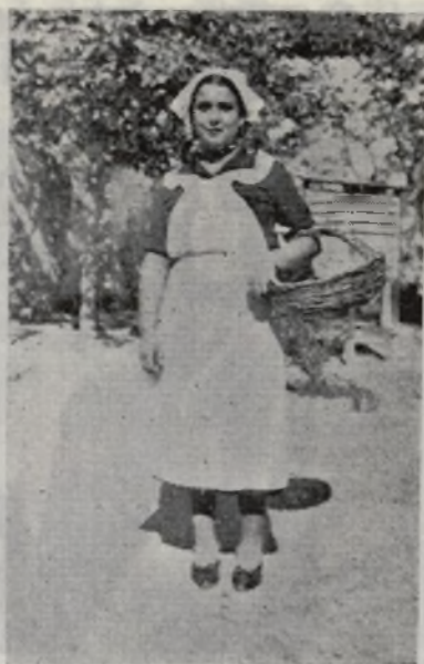
Una asidua falangista preparada para prestar servicio

Las jerarquías, con mano experta, van guiando la nave del Estado con paso firme y tacto sin igual, hacia los horizontes de Imperio que tu mostraste tantas veces con tu verbo fogoso y viril y