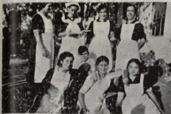
Personal del Comedor «Pemán»