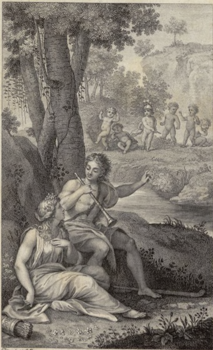
Disegnato per G. Ferro.