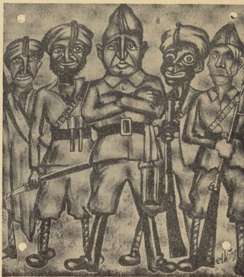
Els nostres adversaris, representants de la civilització

Gràfiques Cuscó : Telèfon 252 : Vilafranca del Penedès