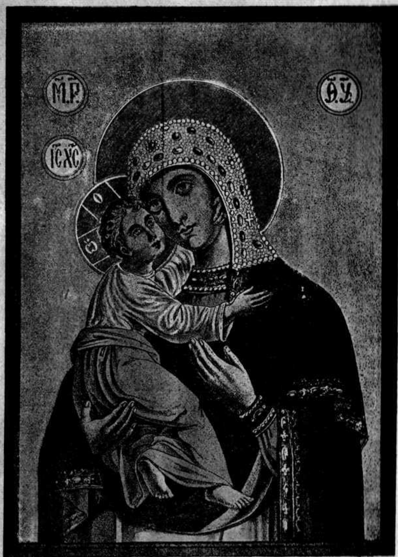
ВЛАДИМИРСКАЯ ИКОНА БОЖІЕЙ МАТЕРИ.