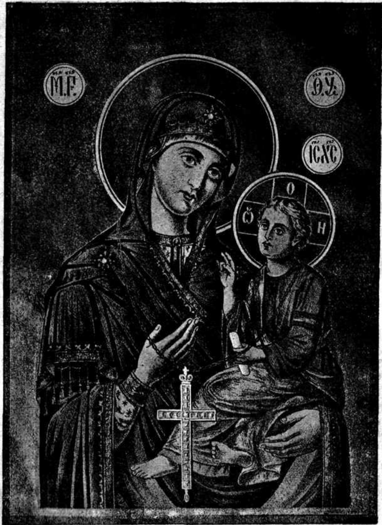
ГРУЗИНСКАЯ ИКОНА БОЖІЕЙ МАТЕРИ.