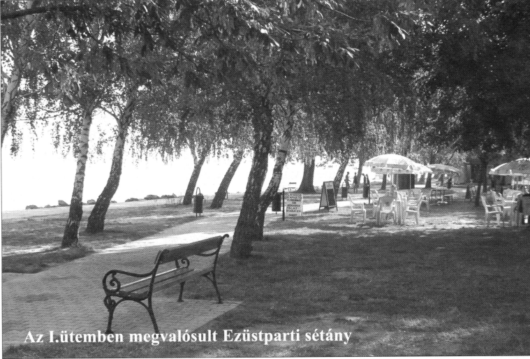
Az I.ütemben megvalósult Ezüstparti sétány