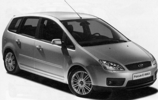
A képen látható autó illusztráció!

Ford Focus C-MAX Minőség. Megbízhatóság.