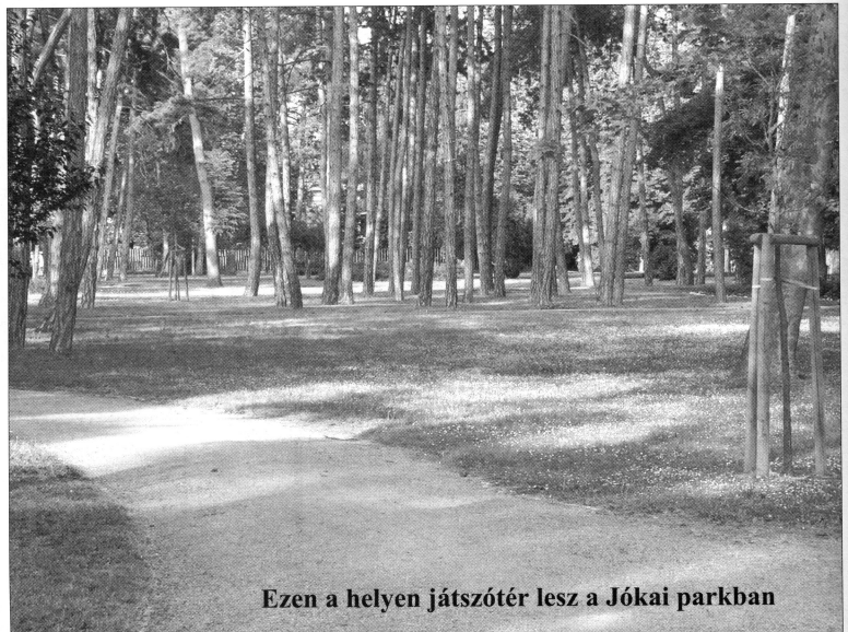
Ezen a helyen játszótér lesz a Jókai parkban

A Jókai-park dél-nyugati sarkában egy játszótér építéséhez kapott a város ötven százalékos támogatást, s az elnyert ötmillió forinthez ugyanennyit kell hozzátenni. A város egyik legjelentősebb parkjának felújítási programja több évvel ezelőtt elkészült, s akkori árakon számolva mintegy 250-260 millió forintba került volna. Miután a város hiába próbálkozott e hatalmas összeg előteremtésére, hiába pályázta meg háromszor is a különféle lehetőségeket, a városvezetés úgy döntött, hogy részleteiben próbálja meg felújítani a patinás közterületet. Ennek első eredménye, hogy néhány évvel ezelőtt egy kisebb összeget sikerült nyerni, amelynek segítségével a park északi oldalán, a Kodolányi Főiskolával szemben elkezdődött egy pihenő sziget kiépítése és a díszburkolat egy részének megvalósítása. E program folytatásaként adott be pályázatot a város gyermekjátszóterének építésére, s nyert ötmillió forintot, amelyhez ugyanennyi önrészt kell biztosítani. Úgy tűnik tehát, hogy a Jókai-park egészének felújítására továbbra sem sok az esély, részletekben azonban fokozatosan megújulhat. Az eredménytelen hazai pályázat mellett a város más lehetőségek után is nézett. Jelenleg folyamatban van két uniós pályázatuk (PEA, Phare). Az első (PEA) a siófoki parkok, zöld felületek építésére, felújítására nyújtották be. A program tervezett költsége 825 millió forint. Az igényelt támogatás 90%, a saját forrás 10%. A második (Phare) a Jókai park rekonstrukcióját