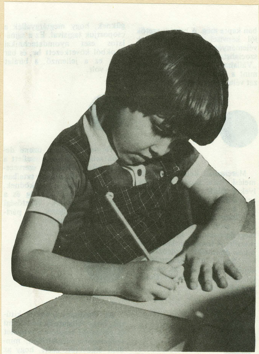
Kép a PEMÜ solymáni „Kék” óvodájából.