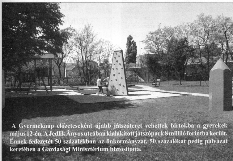
A Gyermeknap előzeteseként újabb játszótérrel bővítették a gyerekek május 12-én. A Jedlik Ányos utcában kialakított játszópark 8 millió forintba került. Ennek fedezetét 50 százalékban az önkormányzat, 50 százalékát pedig pályázat keretében a Gazdasági Minisztérium biztosította.