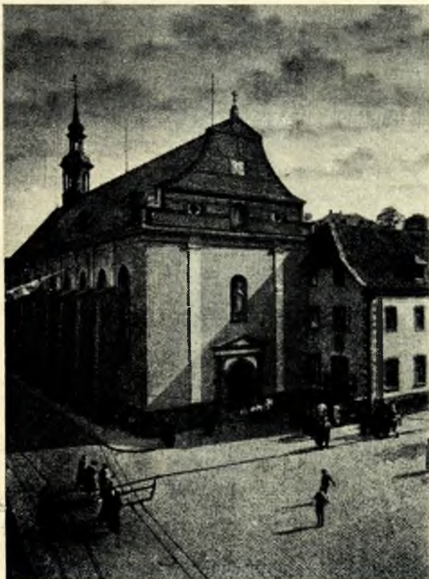
A hardenberg-neuigesi kegytemplom.

A papok és katolikus vezetőgyéniségek koncentrációs táborokban, sőt — mi több — börtönökben sínylődnek, mert ténykedésük fészélyezi a „nácik” propagandáját. Az állam cenzura alatt tartja a sajtót, — még a püspöki körleveleket és plébániai közleményeket