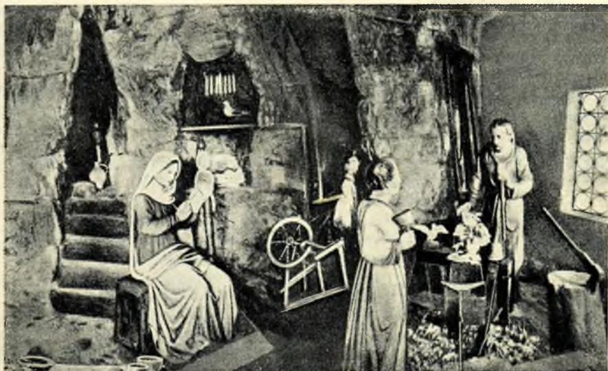
A názárethi ház Herdenberg-Nevigesben a búcsújáró helyen.

időnek, egymásután érkeztek meg a városból. Összeismerkedtem velük. A Szentföld rajongói voltak valamennyien. A legtöbben már jártak is a szent helyeken és most olyan boldog örömmel fogadták lelkükbe az eléjük táruló sok szépséget, mint a gyermek a karácsonyfát. Megcsodálták a gyümölcsöst, a kedves madáretetőt, a lourdesi barlangot, az üvegházat, ahol majd a szentföldi virágok fognak nyílni. És áhítattal hallgatták, — magamat is beleértve — hogy már készül a 15 m. hosszú, 4.20 m. széles, külön múzeumépületet, ahol írásban és képen fog felvonulni a Megváltás