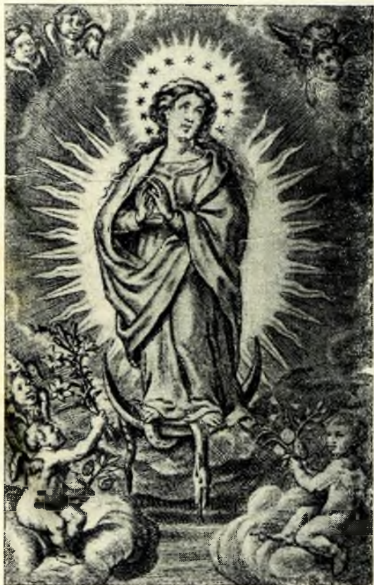
A hardenberg-nevigesi ferences búcsújáráshely kegyképe. 1934-ben 300.000 zarándok kereste fel ezt a híres és szép kegyhelyet.

És a papság tehetetlenül, szomorúan áll az új vallás úttörése előtt, amely annyival is inkább veszélyes, mert sem nem istentelen, sem nem pogány. A nemzeti szocializmus-vallás, de se katolikus, se protestáns. A fajelméletből és a német földből indul ki s a tömegeket lényegileg német hit felé vezet, s végét akarja vetni a vallásbeli szétesztődésnek, amely idáig elérőtlenítette a német népet. Hogy megvalósíthassák és végre hajthassák a német nép egyesítését, a „német vallás“-nak szükségszerűen le kell rombolnia a katolicizmust, amelyet Rosenberg Alfréd a III. birodalom ellenségeként jelölt meg.