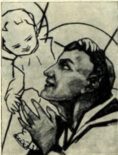
Páduai Szent Antal Jézuska barátja.

tőn. Azt ajánlom, hogy tartsunk kilencedet Szent Antalhoz, hogy sügion. Már úgyse lehet szorul-szóra megtanulni az egész könyvet! Holnaptól kezdve menjünk valamennyien szentmisére és szentáldozáshoz reggel. Kilenc napon keresztül.