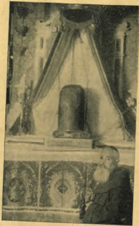
Annak az oszlopnak egyik része, amelyikhez kötözve ostromozták meg Jézust. Látható a ferencesek Szentsírkápolnájában a jeruzsálemi Szentsír-bazilikában.

fölfedezni a lélek «igazi arcát», de nem egyszerű, közönséges szavak vagy cselekedetek mögött milyen nagy, vagy