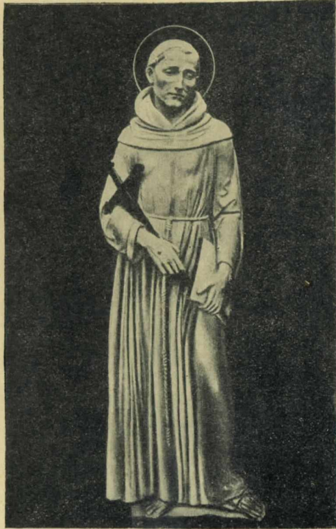
SV. FRANTIŠEK SERAFÍNSKY.