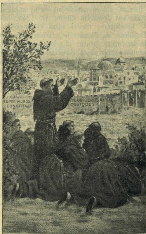
Sv. František Serafínský so svojimi prvými spolubratmi pred Jeruzalemom roku 1219.