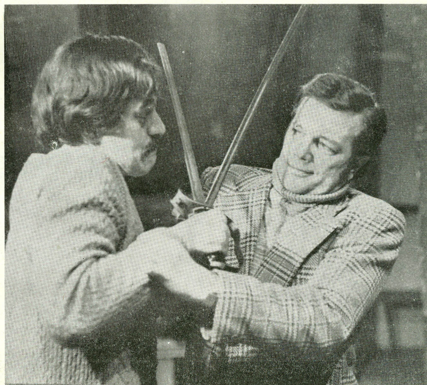
A Játékszín '77 újdonsága: KÉT FERFI SAKKBAN