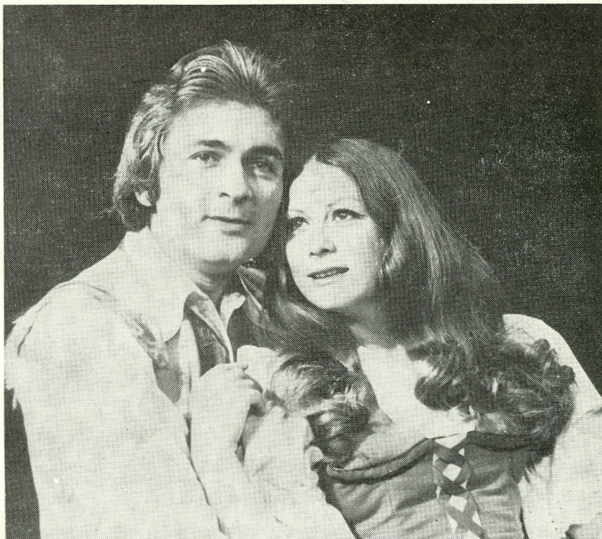
Karácsonyi meglepetés a legfiatalabb nézőknek: HAMUPIPÓKE