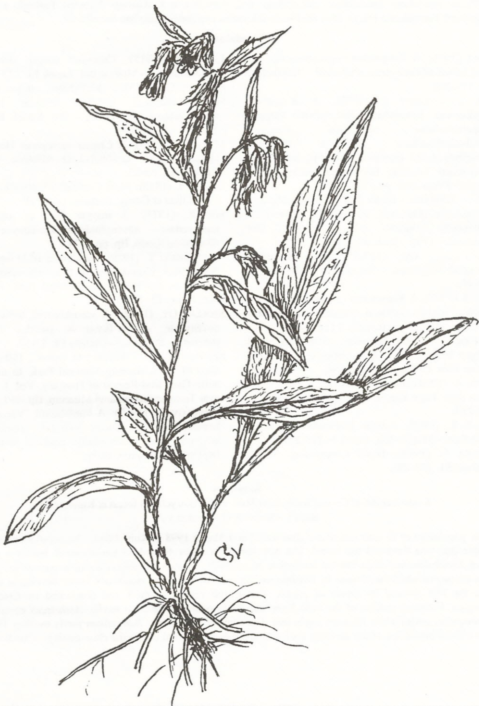
Pulmonaria filarszkyana JÁV. – CSAPODY Vera rajza.