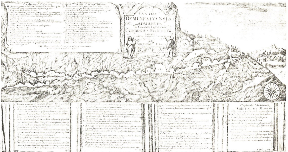
A deménfalvi barlang szelvénye Bél Mátyás Prodrómusában (1723)

A deménfalvi barlang ősmaradványainak sorsa a legszebb példa arra, hogyan szál egy-egy monda apáról fiúra s hogyan vándorol egy-egy lelet tudóstól tudósig, míg végül elkövetkezik az az idő, amikor a tudomány ki tudja bontani a mitikus burokból a valóságot és megfejti a monda eredetét. Ha Hain és Vollgnad nem csatolnak munkáikhoz képeket, valószínűleg sohasem születik meg Rosenmüller magyarázata és az egykori lelet értékét veszítve, pusztán fantasztikus híradás lenne.