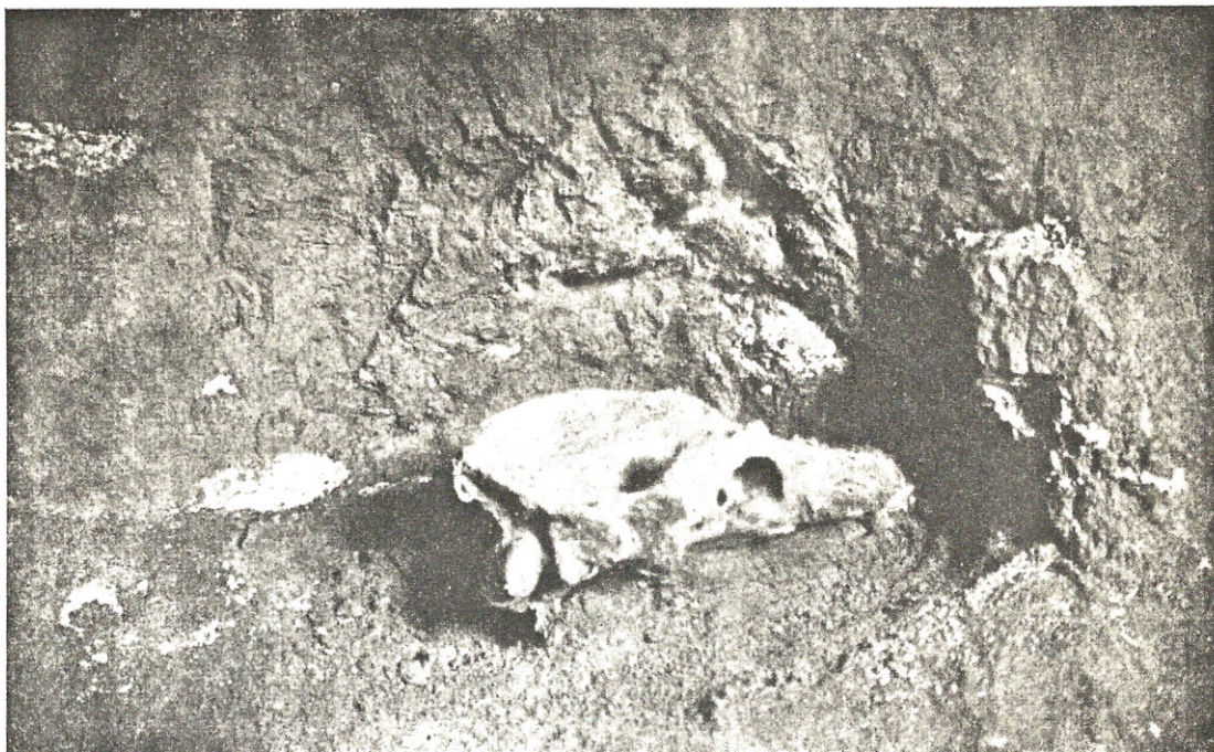
Barlangi medve ( Ursus spelaeus Rosenmüller) koponyája a Mxlntz-I (Stelermark) sárkánybarlangban

Két évvel később, 1806-ban napvilágot lát Párizsban a francia természetbúvárok atyjának, Cuvier -nek a tanulmánya Németország és Magyarország barlangjainak kihalt medvéiről. Úttörő munkájában egyenesen a szakemberekhez fordul, nehogy továbbra is tévúton járjanak! Senki se higgye, hogy sárkányok élnek, vagy valaha is éltek a magyarországi barlangokban, vagy bárhol a világon.