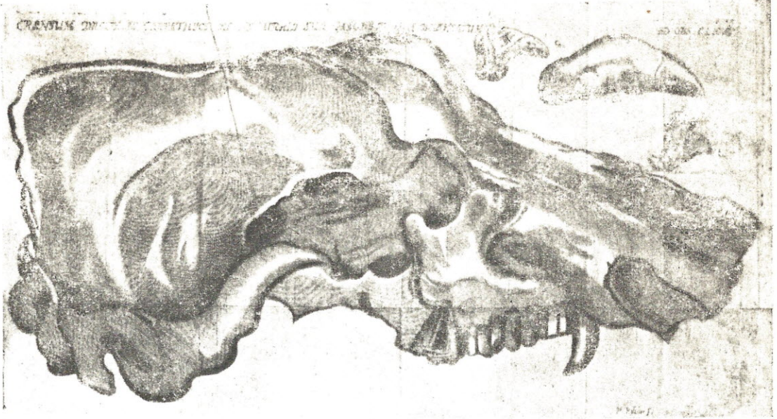
A barlangi medve koponyája Vollgnad munkájában (1673)

resztsont, mert akkora volt, mint egy nagy nyereg.