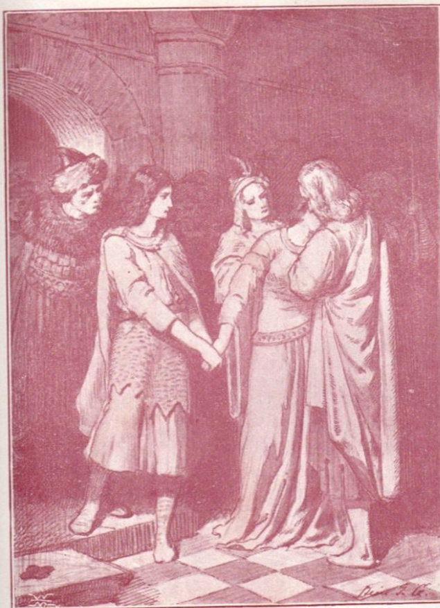
Elek: Légy boldog, drága lélek!

Zsigmond . Nem, kedves leányom! éltünknek urai nem vagyunk; és az ég keményen bünteti meg az erőszakos halált; hallgasd hát,