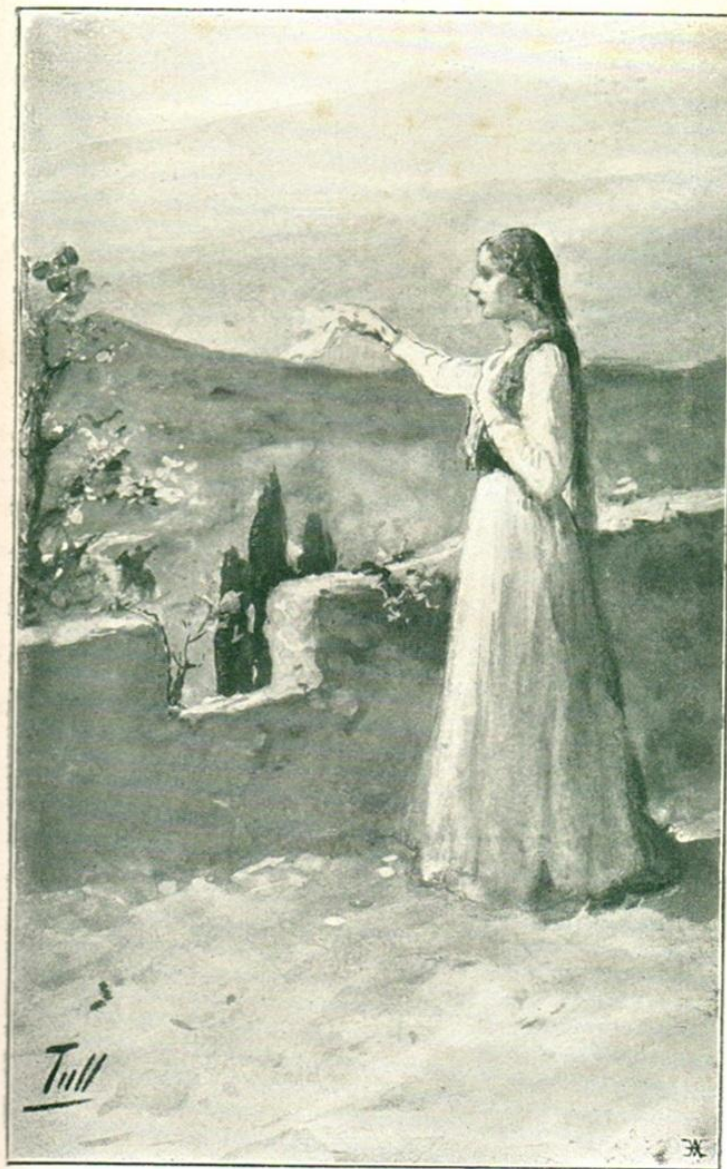
Szemmeredve nézi a szűz A távozó szeretőt.

Epedőnek a szép szűz.) Élj! s légy boldog kezem által, Ha megszűnván a harcz-tűz, Te megint új borostyánnal Koszorúzva visszatérsz. Esmerem én belső becsed, Érzi szívem, mennyit érsz. Meglásd! hogy a leány-szívek, Bár nem mélyek, mégis hívek, Hogy hazugság a köz-szó, S én nem leszek változó.