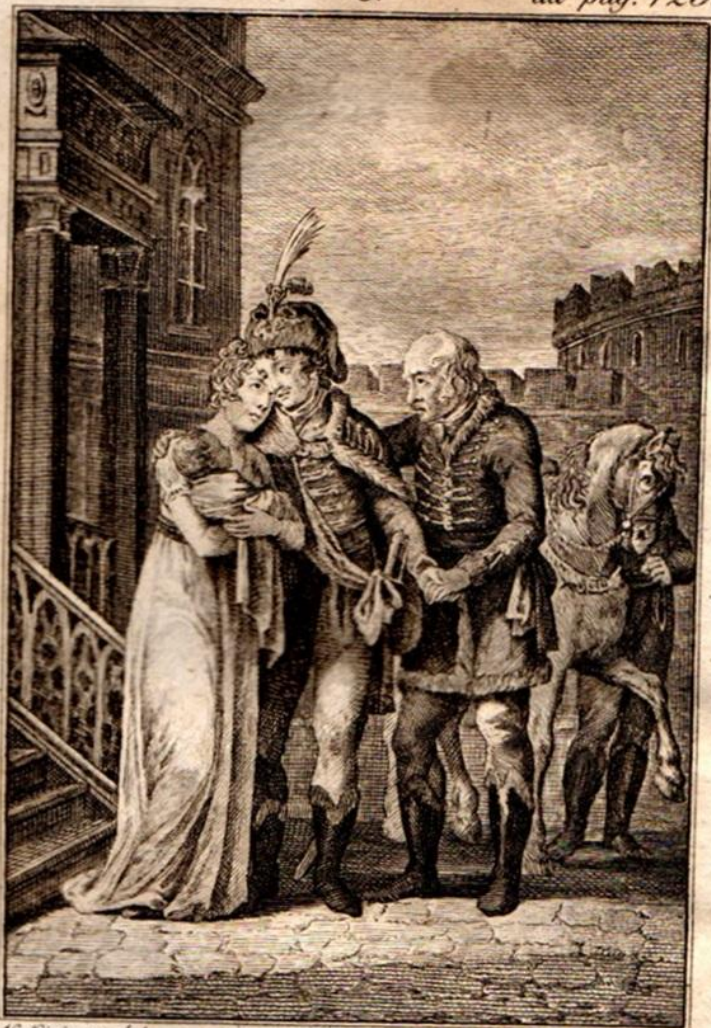
V. Krieger del.