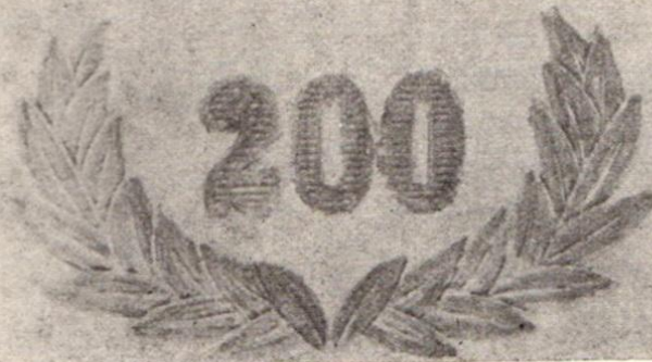
A Sümegi Kisfaludy Sándor Emlékbizottság ünnepi meghívó-programja