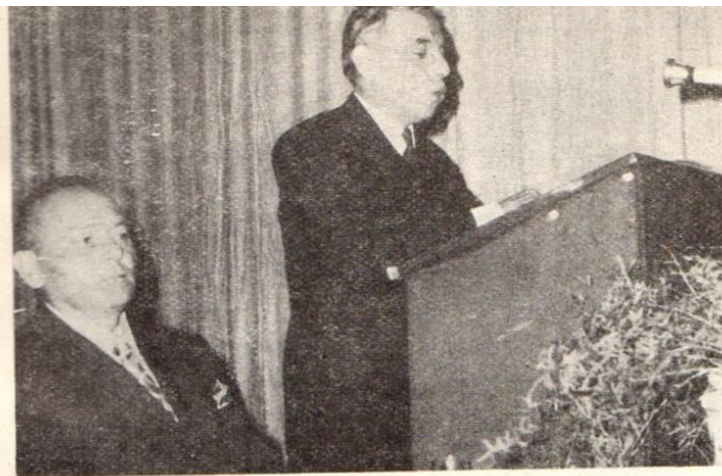
Emlékünnepség Kisfaludy Sándor tiszteletére. Elmondta: Simon István Kossuth-díjas költő, országgyűlési képviselő