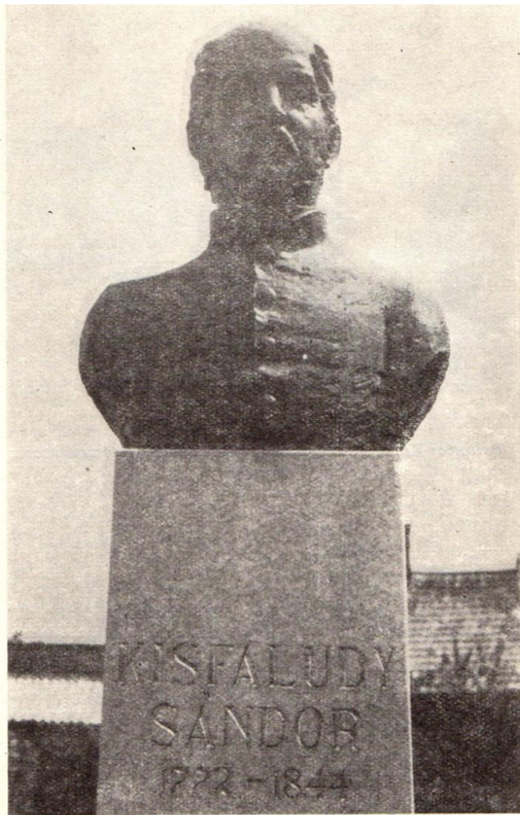
Kisfaludy Sándor felavatott mellszobra a gimnázium udvarán