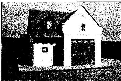
A Tűzoltószertár felújításának makettfotója

A VÁÉV-Bramac hód farkú cserép felajánlásával, az MSZP ügyvezető elnöke a teljes tetőfaanyag biztosításával járul hozzá a múzeum és a nyugdíjsház, illetve a tűzoltószertár rekonstrukciójához, ingyenesen! Az Ipartestülettel történt őszi megbeszélésünkhöz híven az Egylet újfent felajánlja az épület tetőanyagának ingyenes átadását.