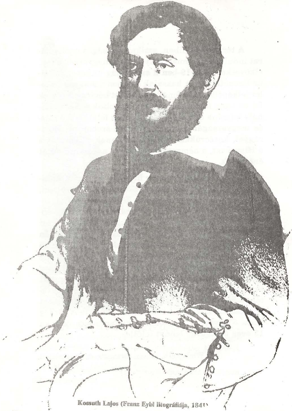
Kossuth Lajos (Franz Eybl litográfiája, 1841)