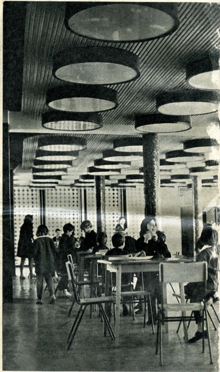
Egy fiú, három lány, teljes az asztaltársaság