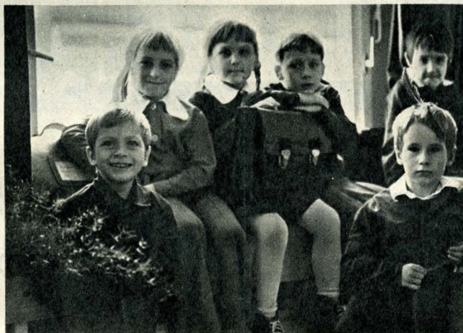
Egy csokor gyerek a legapróbbak közül