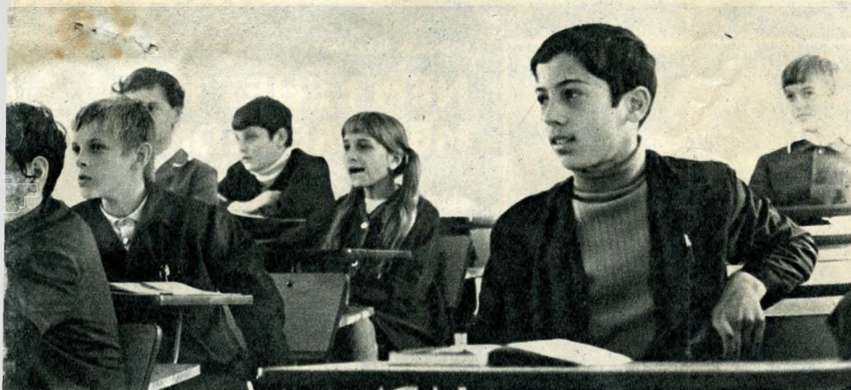
A ragyogó, világos osztálytermekbe be se téved az árnyék