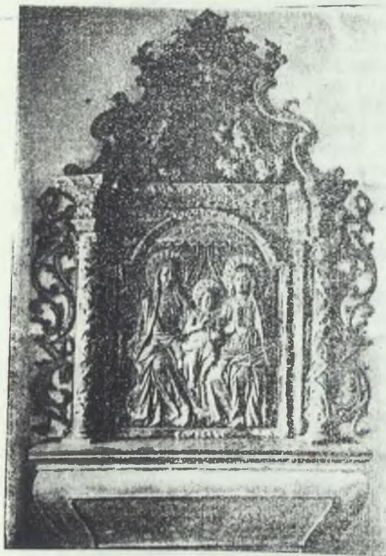
A kolostor egyik nevezetes barokstiliu emléke.