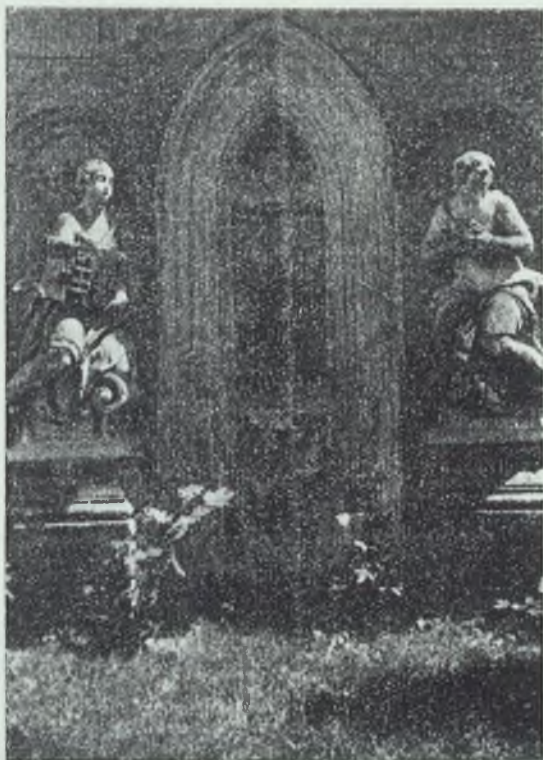
A régi Szent-György-Úr templomának emléke.