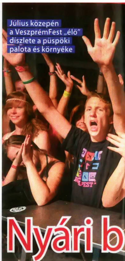
Július közepén a VeszprémFest „élő” díszlete a püspöki palota és környéke