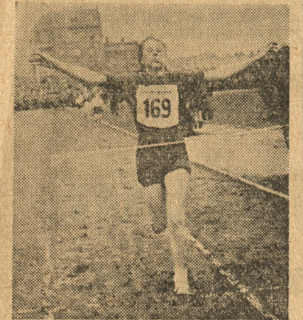
Cieślakówna na mecie przybyła jako pierwsza

Z kolei startują panie w liczbie 25. Trasa biegu prowadzi w całości na boi-