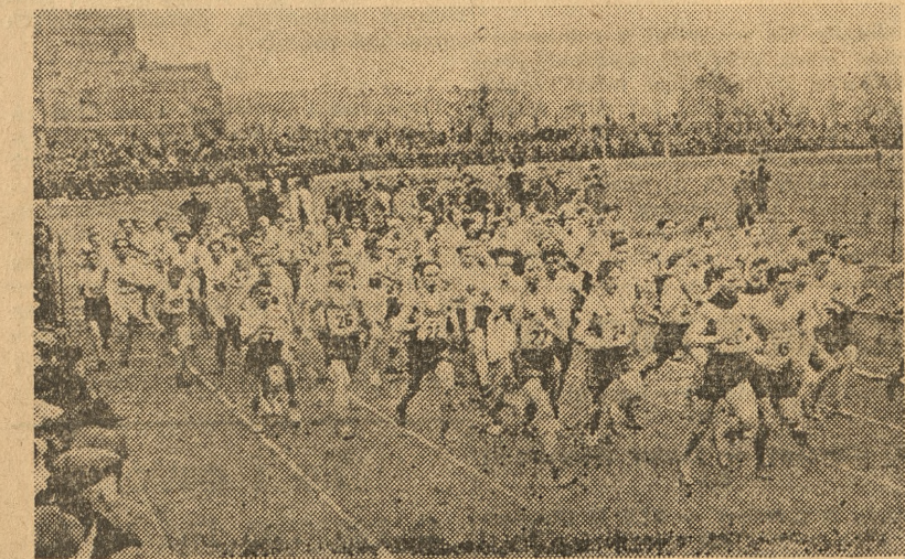
Gremialny udział juniorów, wykazał wielkie zainteresowanie biegiem

by w momencie rozpoczęcia biegów przełajowych osiągnąć ilość ponad 12 tysięcy osób! Rekord rzadko notowany na zawodach z przewagą konkurencji i. a. A dodać należy, że wokół trasy biegów przełajowych, pod względem porządkowym wzorowo pilnowanych przez Milicję Obywatelską oraz harcerzy III Hufca pod komendą pfc Matysika, zebrało się co najmniej drugie tyle widzów. Nie przesadzimy twierdząc, że ponad 25 tysięcy osób o-