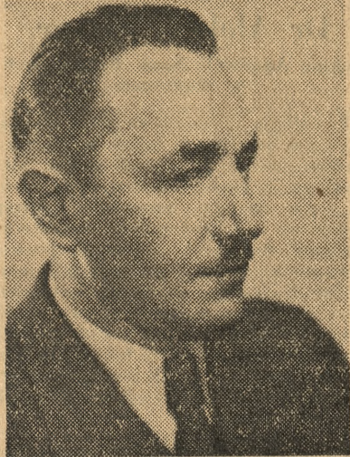
Bolesław Bierut Prezydent Rzeczypospolitej Polskiej