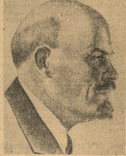
Włodzimierz Iljcz Lenin