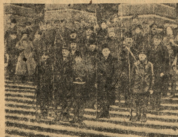
Członkowie Czerwonej Gwardii pod Smolnym Instytutem w Piotrogradzie w roku 1917

„Nie panom wysługiwać się. Nie tron ich wspierać krwawy Wolności ludu bronić chce Czerwony Pułk Warszawy”