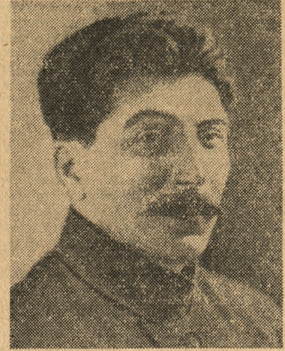
Generalissimus Józef Stalin (Zdjęcie z dni Rewolucji Listopadowej)