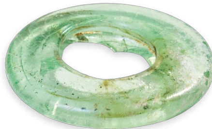
Obod vrča ili boce. Rim of a jug or bottle Die Kante eines Kruges oder einer Flasche Orlo di boccale o bottiglia

Rimsko carstvo to iznimno nestabilno vrijeme, za Tarsatiku je ono početak najprosperitetnijeg razdoblja u njezinoj povijesti. Razlog tomu možemo tražiti upravo u činjenici da je kao jedina pomorska luka i vojno zapovjedništvo u sustavu Claustrae postala mjesto prihvata i razmještaja vojnih postrojbi i svih njihovih potrepaština.