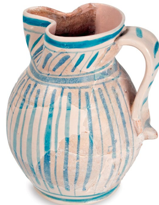
Restaurirani kasnomajolički trbušasti vrč s venetskog područja s kraja 16. st. A restored late majolica belly-shaped jug from the area of Veneto, from the end of the 16th century. Ein restaurierter Bauchkrug, Spätmajolika, aus dem Gebiet von Veneto, Ende des 16. Jh. Boccale panciuto restaurato di maiolica tarda proveniente da territorio veneto di fine XVI sec.