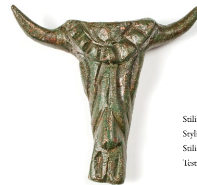
Stilizirana glava bika Stylised bull's head Stilisiertes Stierkopf Testa stilizzata di toro

La ricerca archeologica dei Principia di Tarsatica dal 5 giugno al 4 agosto 2007. Alcuni reperti rinvenuti durante la ricerca.