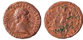
Antička kovanica, 1. st. Roman coin, 1st century Eine Antiqua Münze, 1. Jh. Moneta romana I secolo

Arheološka istraživanja tarsatičkog principija, od 5. lipnja do 4. kolovoza 2007. Dio nalaza pronađenih tijekom istraživanja