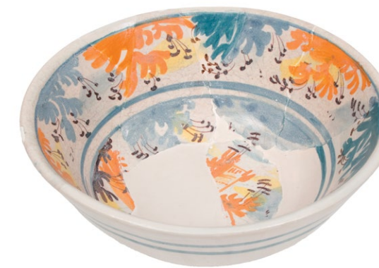
Restaurirana moderna (19.st.) manja višebojno oslikana zdjelica s venetskog područja. A restored Modern (19th century) polychrome-painted small bowl of a smaller size from the area of Veneto. Polichrom bernalte Schale aus dem Gebiet von Veneto, 19. Jahrhundert, restauriert Scodella con ornamento policromo, restaurata, contemporanea (XIX sec.), piccola, proveniente dal territorio veneto