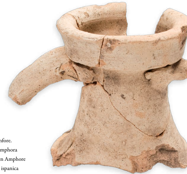
Ulomak hispanke amfore. Sherd of a Hispanic amphora Teil einer hispanischen Amphore Frammento di anfora ispanica