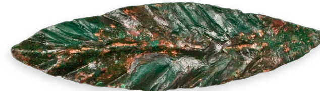
Brončani lovorov list Bronze laurel leaf Das Lorbeerblatt aus Bronze Foglia d'alloro in bronzo