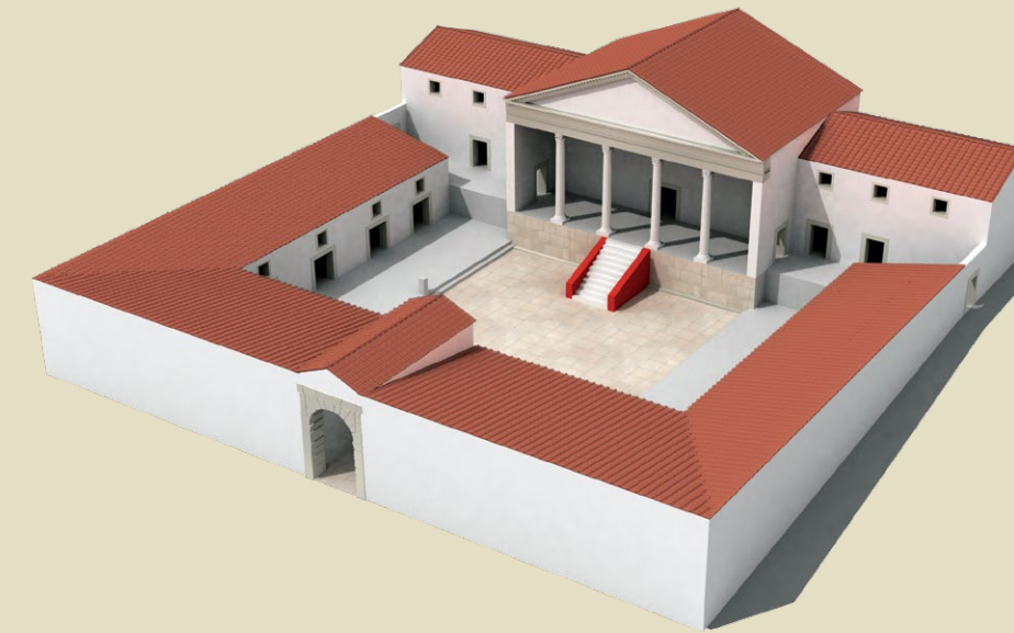
Idejna rekonstrukcija tarsatičkog principija. A conceptual reconstruction of Principia at Tarsatica. Die konzeptuelle Rekonstruktion der Tarsatica Principia. Ricostruzione simulata dei Principia di Tarsatica.

La ricerca archeologica dei Principia di Tarsatica dal 5 giugno al 4 agosto 2007. Alcuni reperti rinvenuti durante la ricerca.