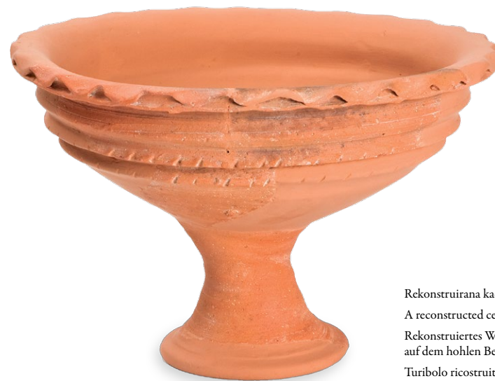
Rekonstruirana kadionica na šupljom nozi A reconstructed censer on a hollow stem Rekonstruiertes Weihrauchfaß auf dem hohlen Bein Turibolo ricostruito su piede cavo

we recognise the monumental main entrance, the central tiled courtyard, the basilica, the storage buildings and offices. It was exactly the construction of the Principia that represented a turning point in the development of Tarsatica and the beginning of the city's strong social development and urban planning. Although for the Roman Empire that was a very unstable period, for Tarsatica it marked the beginning of the most prosperous period in its history. We may search for reasons behind this in the fact that as the only sea port and military command included in the system of Clastra, Tarsatica became the place of the acceptance and deployment of military forces and all their requisites.