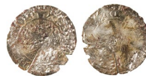
Srednjovjekovna kovanica, 15. st. Medieval coin, 15th century Eine mittelalterliche Münze, 15. Jh. Moneta medievale, XV secolo