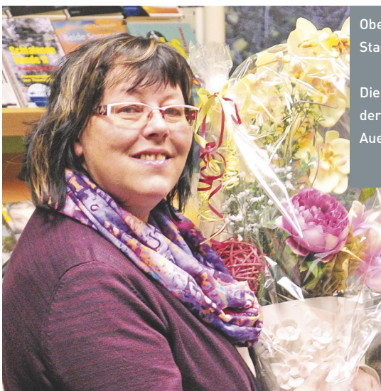
Oben: Die preisgekrönte Stadtbibliothek Auerbach.