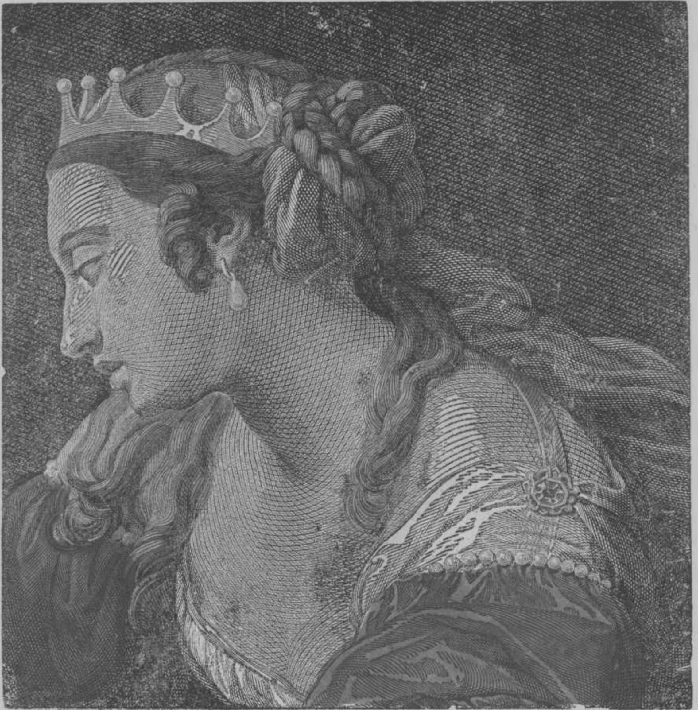
DE WEDUWE VAN NAPOLEON III.