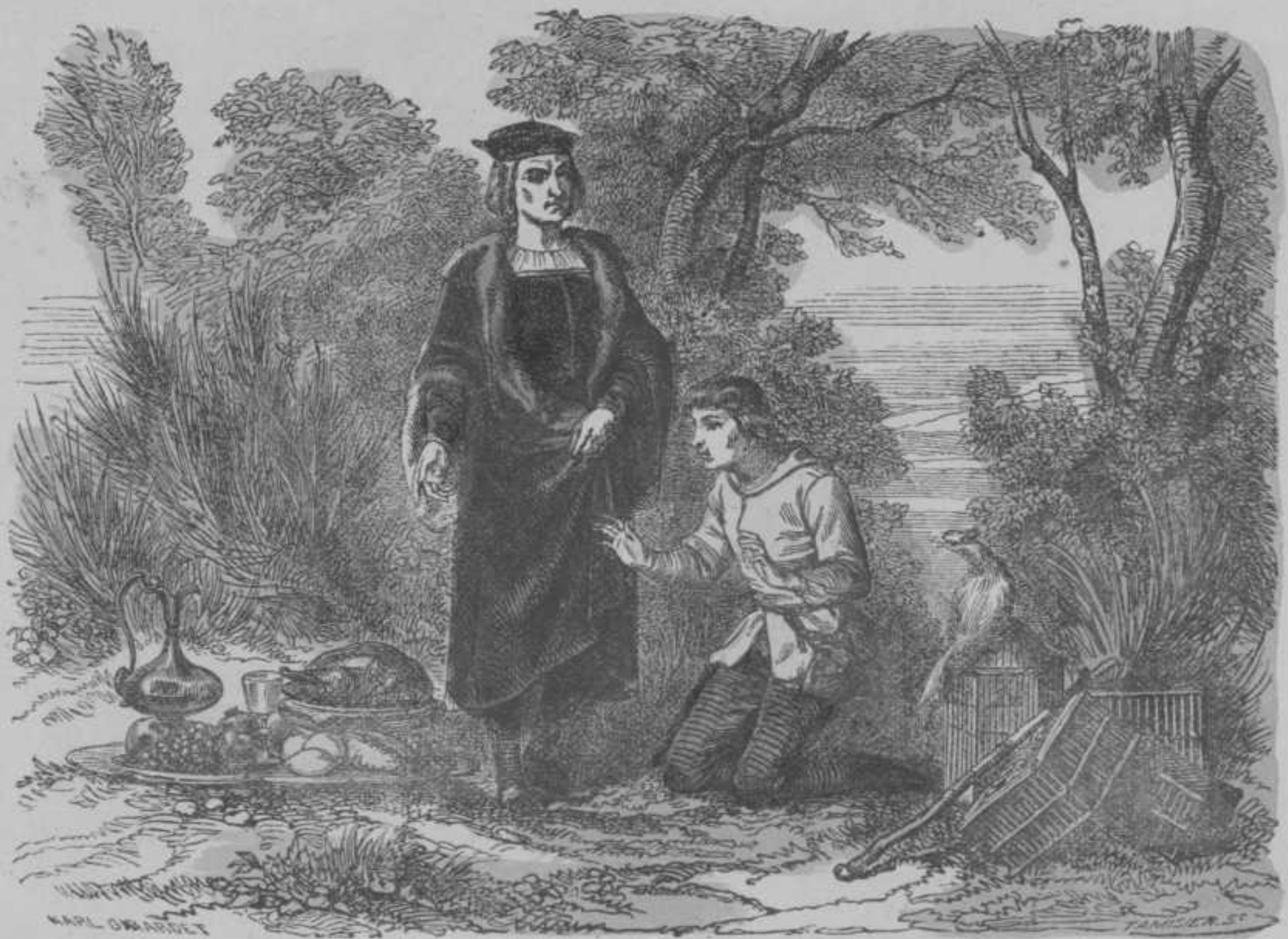
HIJ WEET HET NIET.