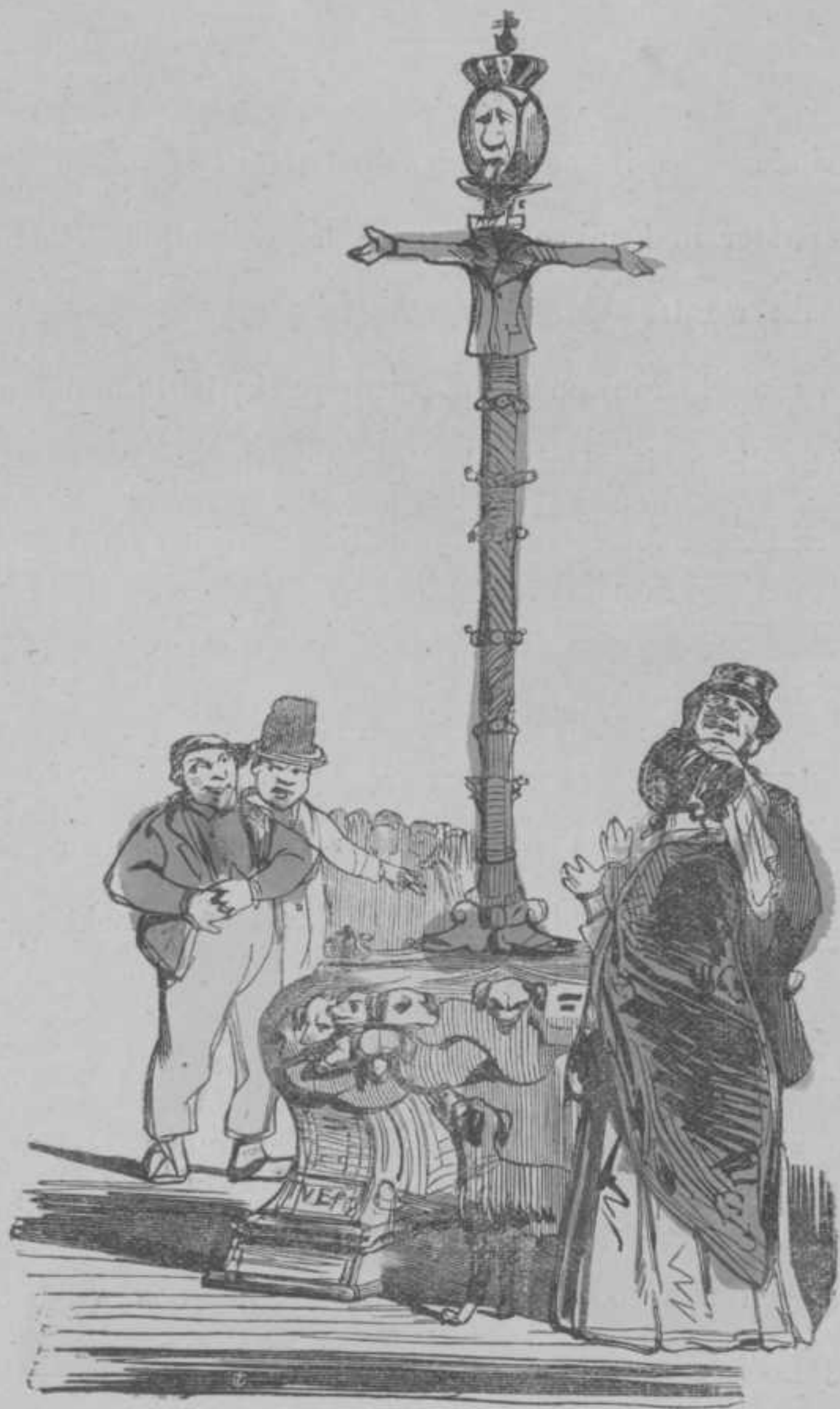
DE OUDE LANTAARN.