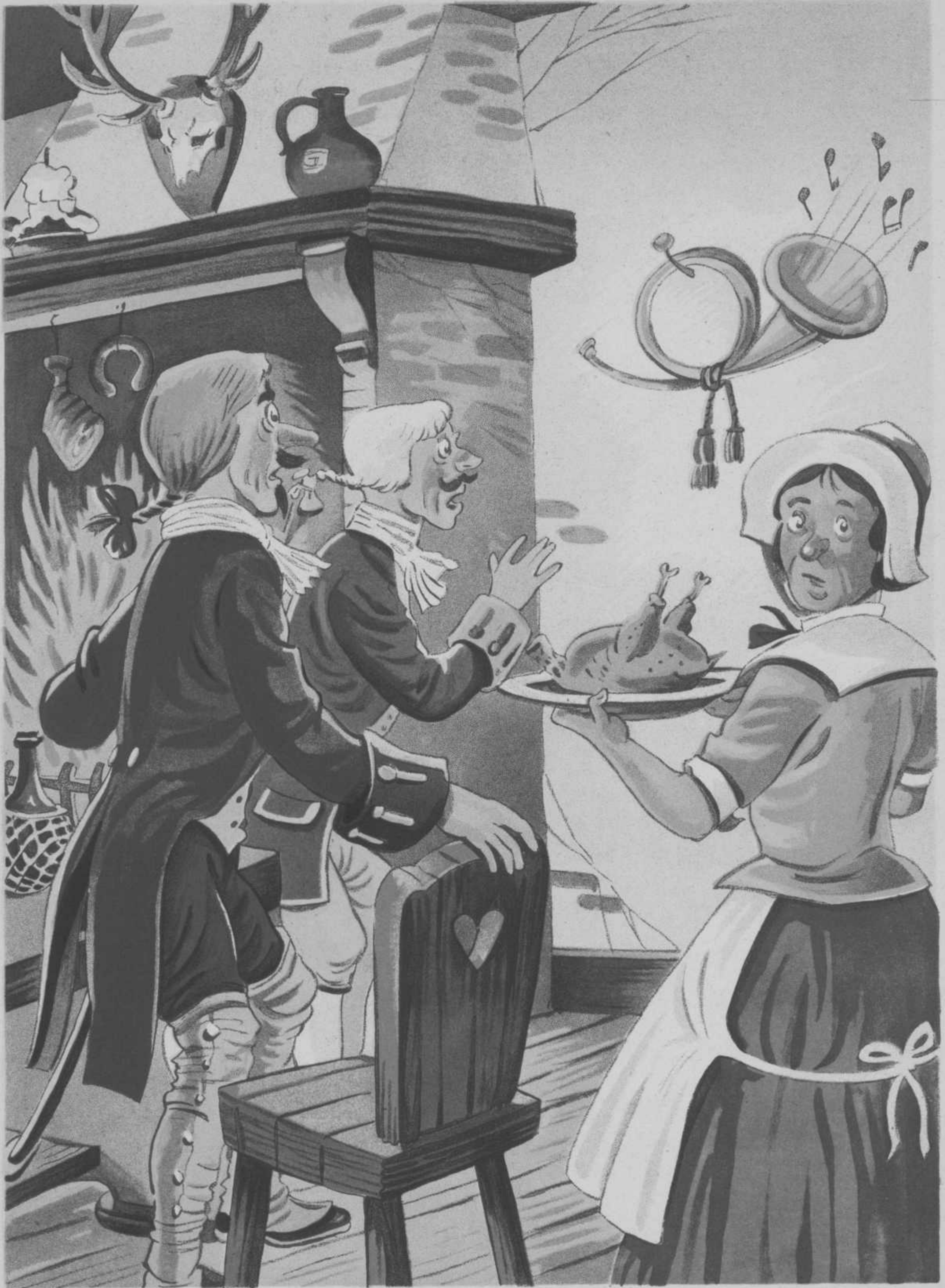
Iedereen is erg verbaasd, Dat de hoorn een liedje blaast.