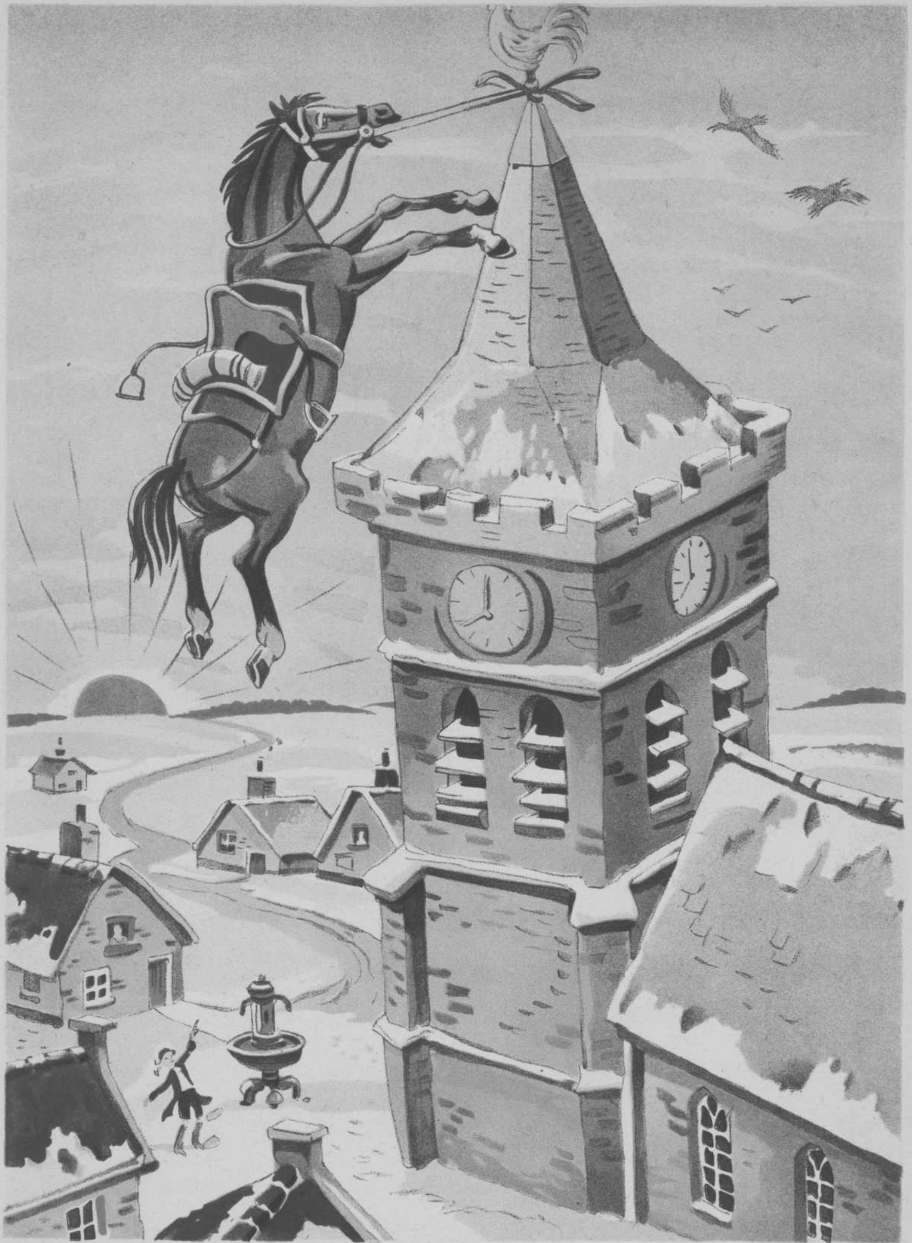
O, o, wat een ongemak, 't Paard hangt boven aan het dak!