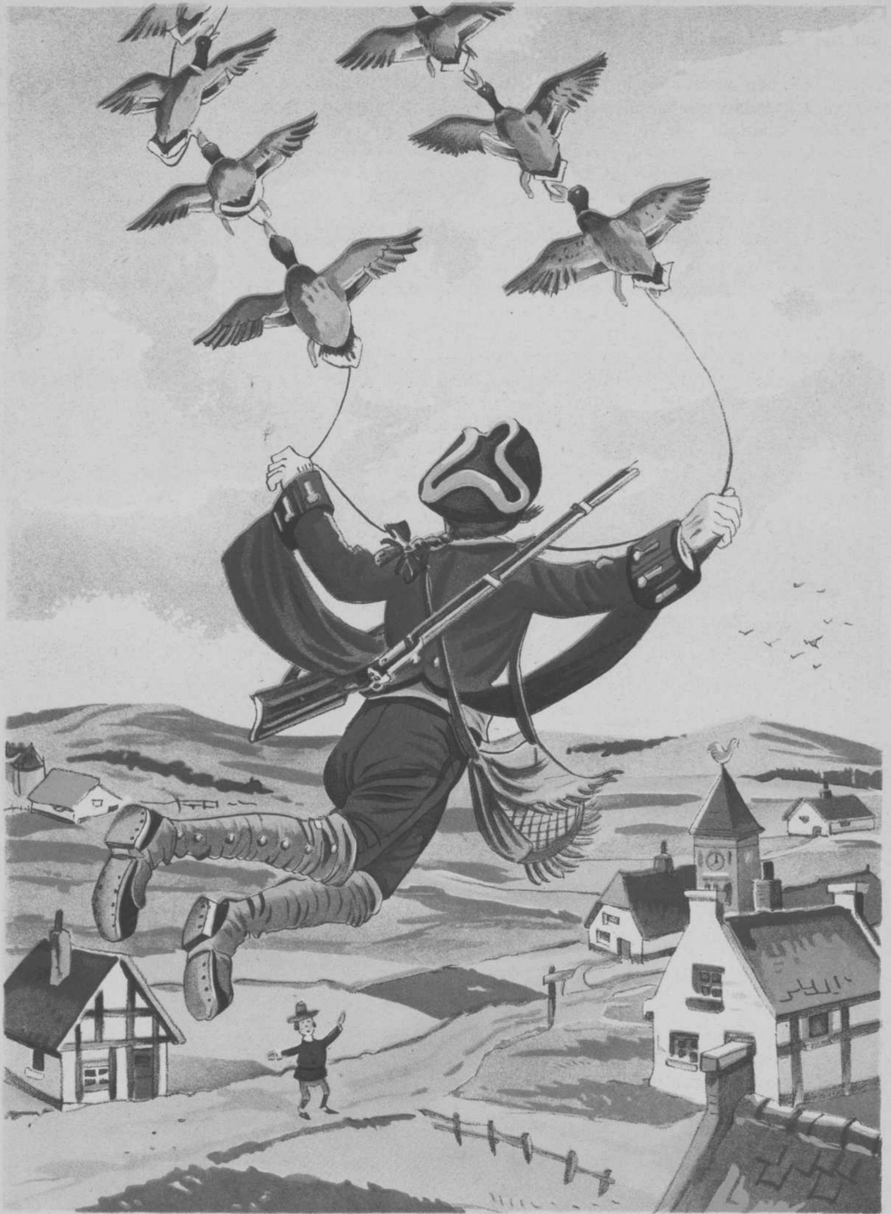
De jachtbuit neemt hier rap de vlucht En de Baron vliegt door de lucht.