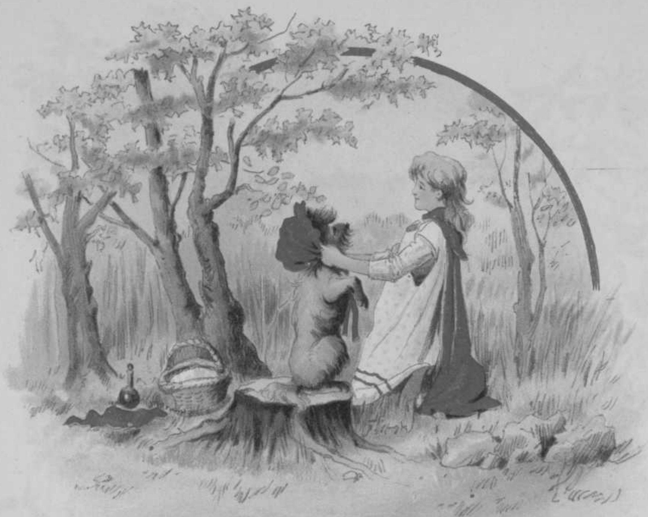
Mooi opzitten, hoor!