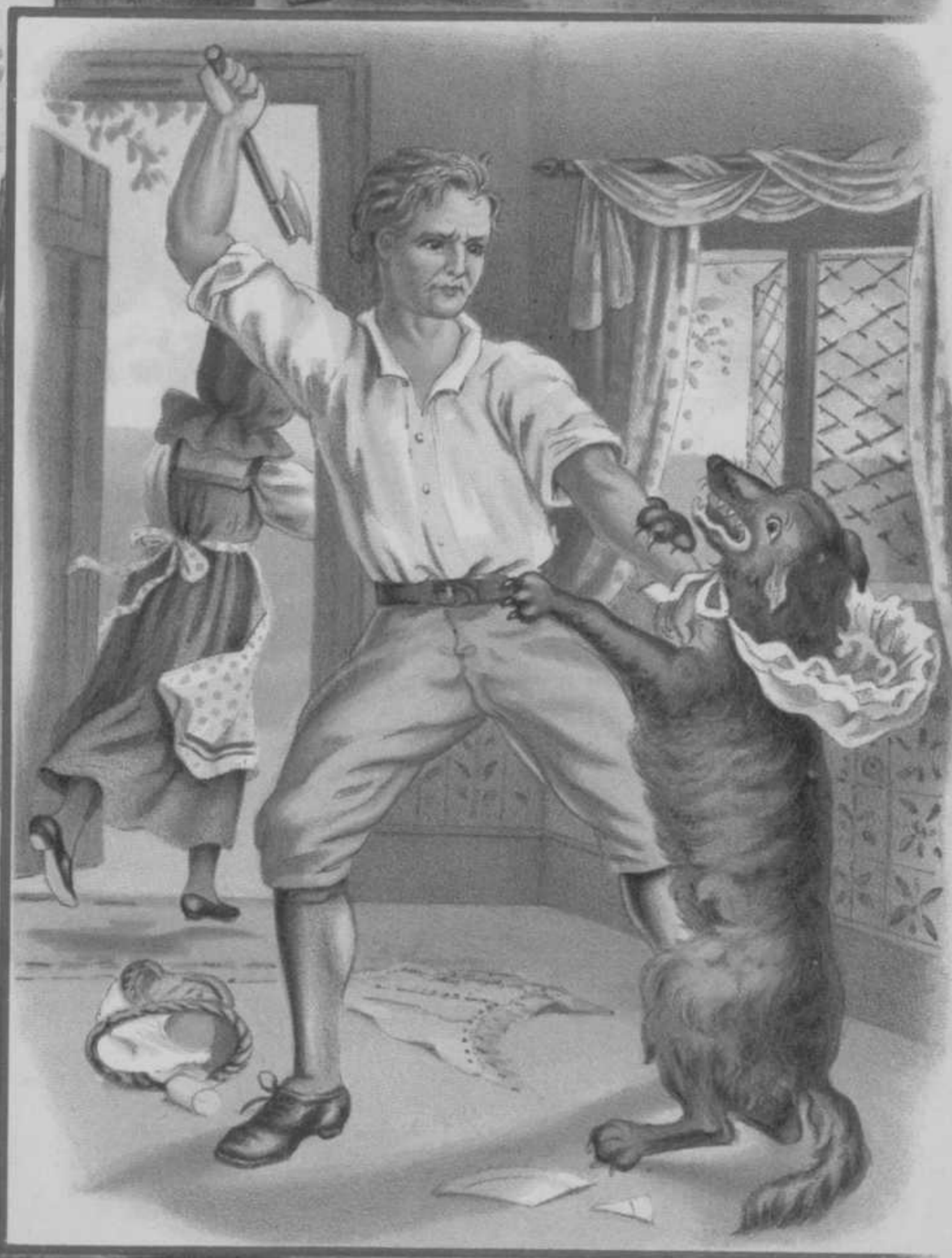
Bij tijds gered.