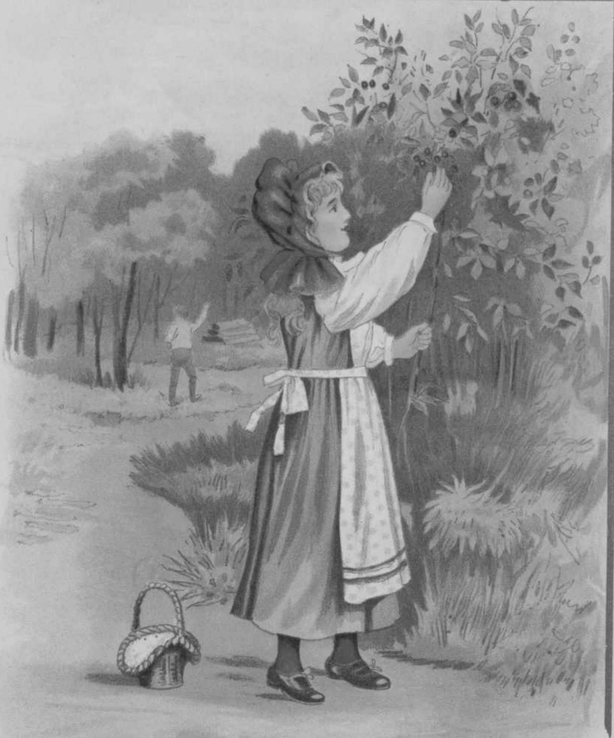
Roodkapje plukt een ruikertje.