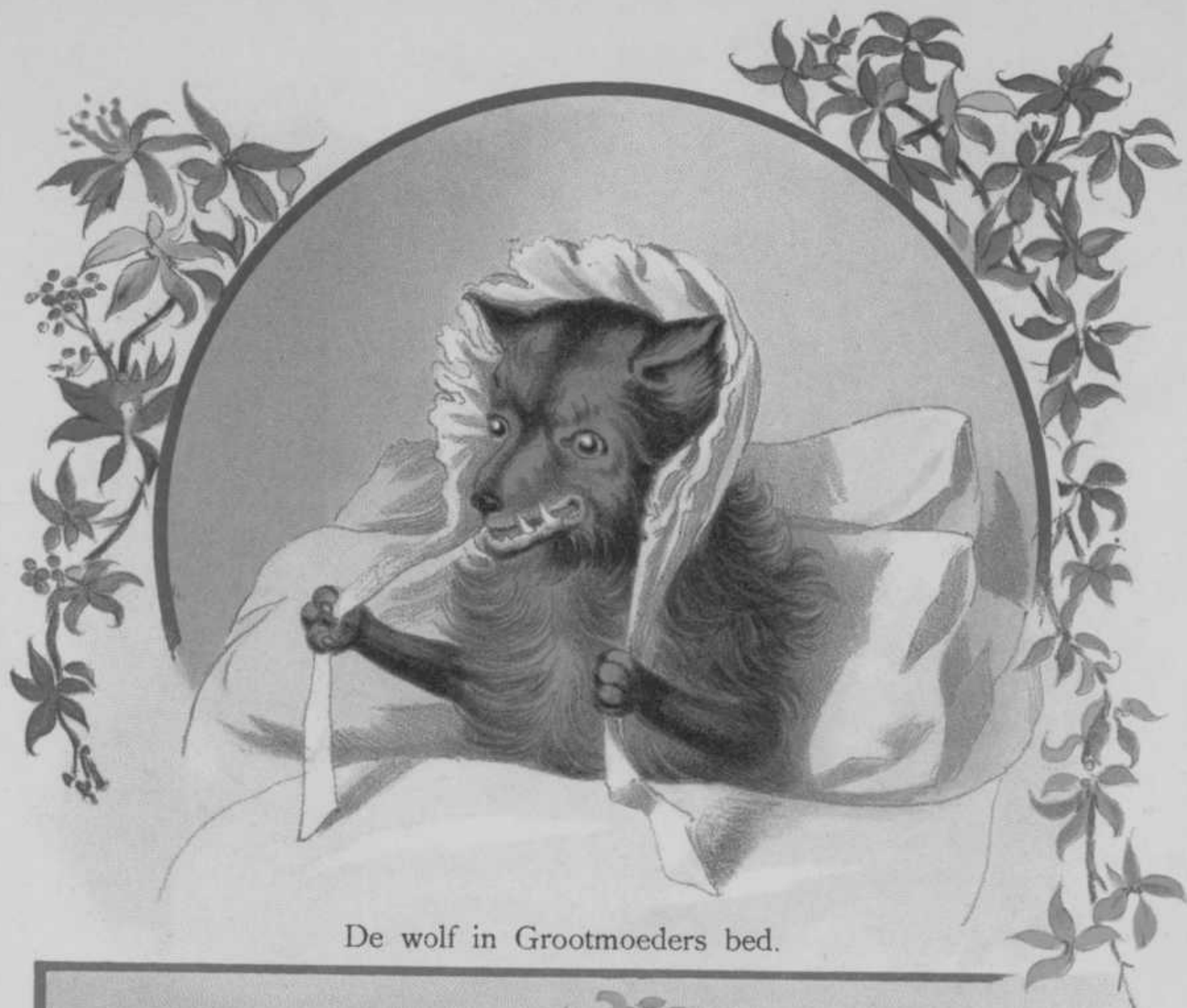
De wolf in Grootmoeders bed.