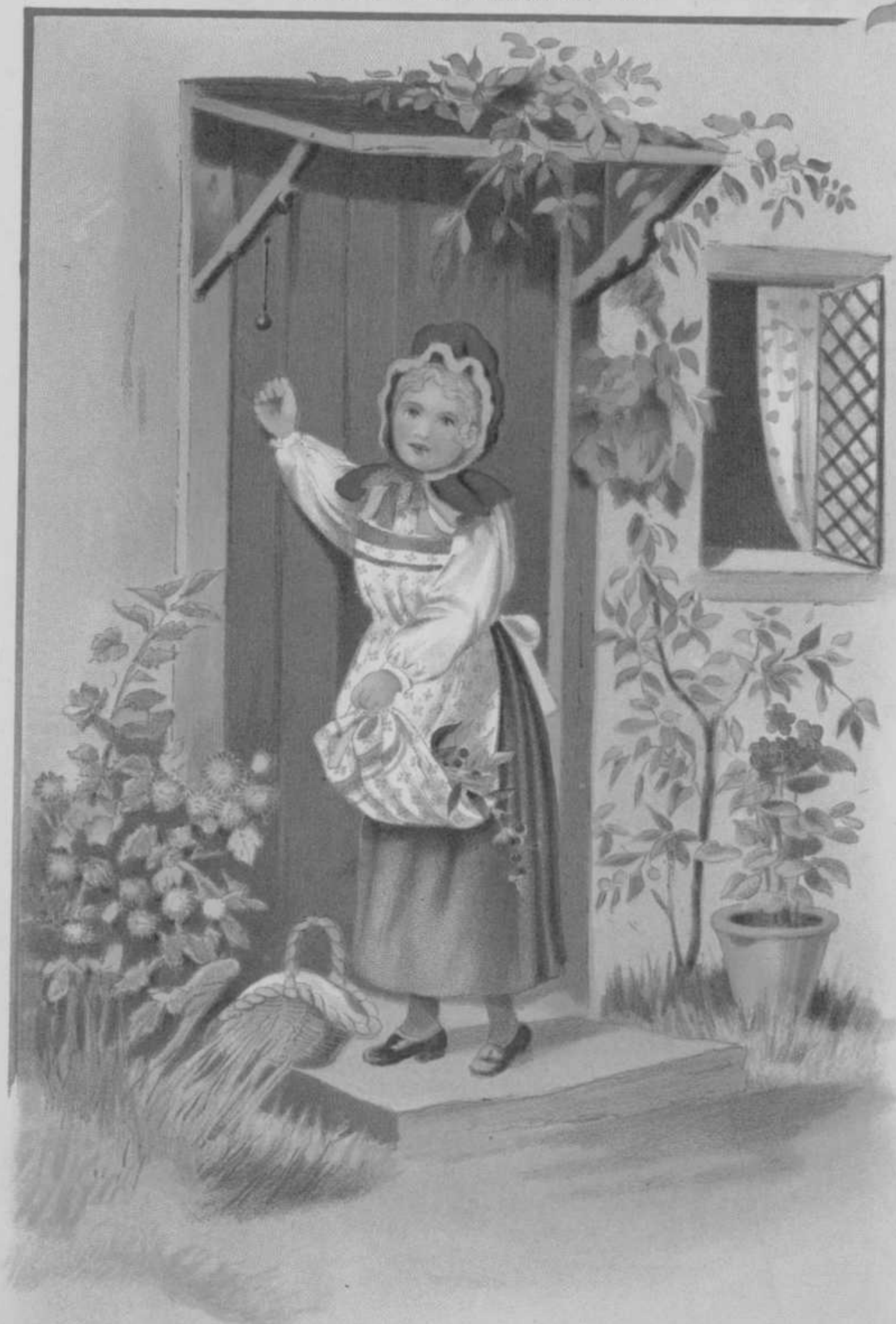
Roodkapje klopt aan.