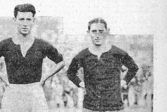
Il meraviglioso successo della festa della stampa sportiva a Berlino...