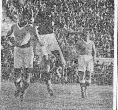
MILAN batte NAPOLI 3 a 1. - Pastore alle prese con Vincenzi