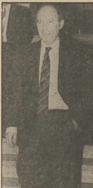
Ο Κ. Σημίτης, χθες το μεσημέρι, ενώ φεύγει από το υπουργείο Εθνικής Οικονομίας

Δεν λέει όλη την αλήθεια ο Σημίτης, υποστηρίζουν κυβερνητικά στελέχη - μέλη του ΑΣΟΠ και επικεντρώνουν τον εσχατισμό τους αυτό πάνω στη φράση του παραιτηθέντος υπουργού Εθνικής Οικονομίας, «Η εισοδηματική πολιτική αποφασίστηκε μετά από συνεχείς συνεδριάσεις και σε απόλυτη συμφωνία μαζί σας», που περιέχεται στην επιστολή, που έστειλε στον πρωθυπουργό. Τα κυβερνητικά αυτά στελέχη τονίζουν ότι με τη φράση αυτή ο Σημίτης παραδέχεται ότι δεν υπήρξε συμφωνία στο ΑΣΟΠ, αλλά προφανώς ότι συμφωνίες με τις απόψεις του ο πρωθυπουργός, πράγμα που δεν μπορούσε να γίνει αλλιώς, αν οι αρμόιοι και τα στοιχεία εμφανίζονταν ως μαύρα κι άραχνα. Ο κ. Σημίτης γνωρίζει και είναι άγνωστο γιατί το αποκρύπτει, ότι στο τελευταίο ΑΣΟΠ υπήρξαν έντονες αντιδράσεις, στην εισοδηματική πολιτική, που εισήγησε. ● ΣΥΝΕΧΕΙΑ στη σελ. 8