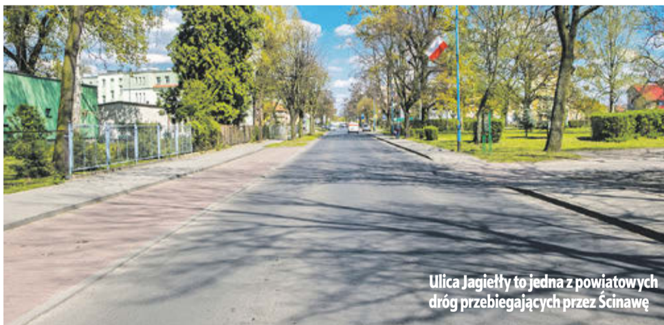
Ulica Jagiełły to jedna z powiatowych dróg przebiegających przez Ścinawę