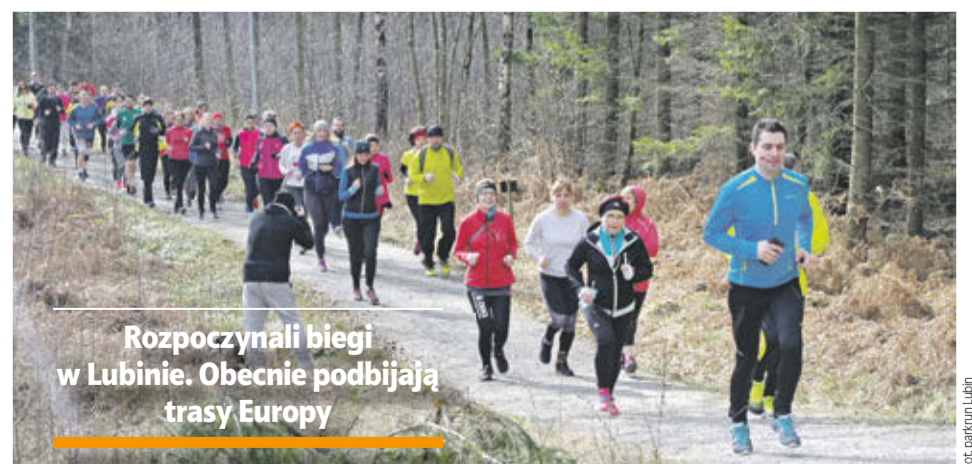
Rozpoczynali biegi w Lubinie. Obecnie podbijają trasy Europy

Po biegu uczestnicy zostali przewiezieni na statek, gdzie można było przebrać