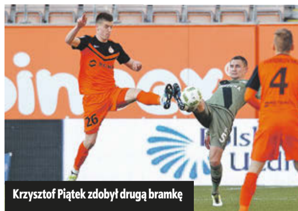
Krzysztof Piątek zdobył drugą bramkę

Legia Warszawa: Malarz – Broż (77. Pazdan), Lewczuk, Jędrzejczyk, Hłosek – Borysiuk, Guilherme – Duda, Prijović (59. Hämäläinen), Kucharczyk (66. Aleksandrow) – Nikolić.