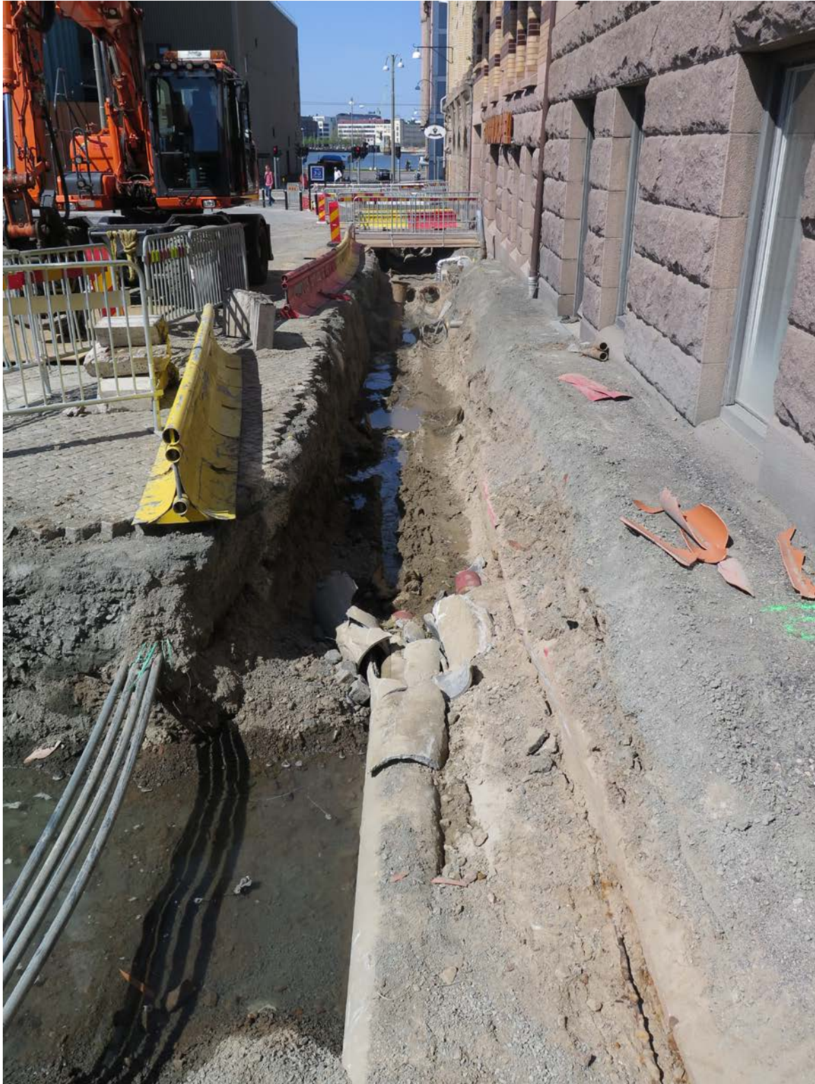
Figur 5. Surbrunnsgatan mot väster.