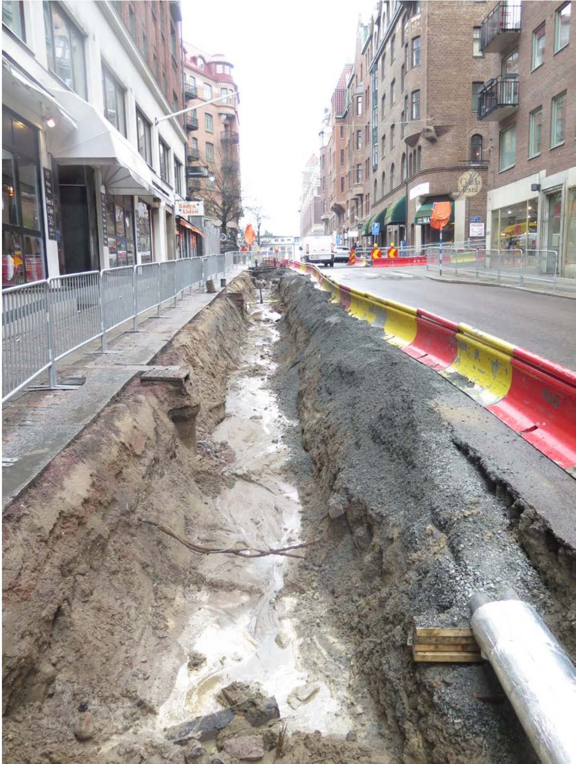
Figur 4. Södra Liden och Kungsgatan mot öster.