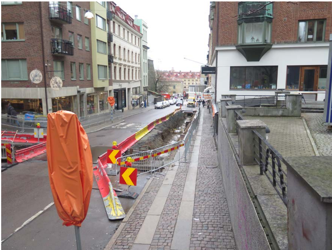
Figur 3. Södra Liden och Kungsgatan mot väster.