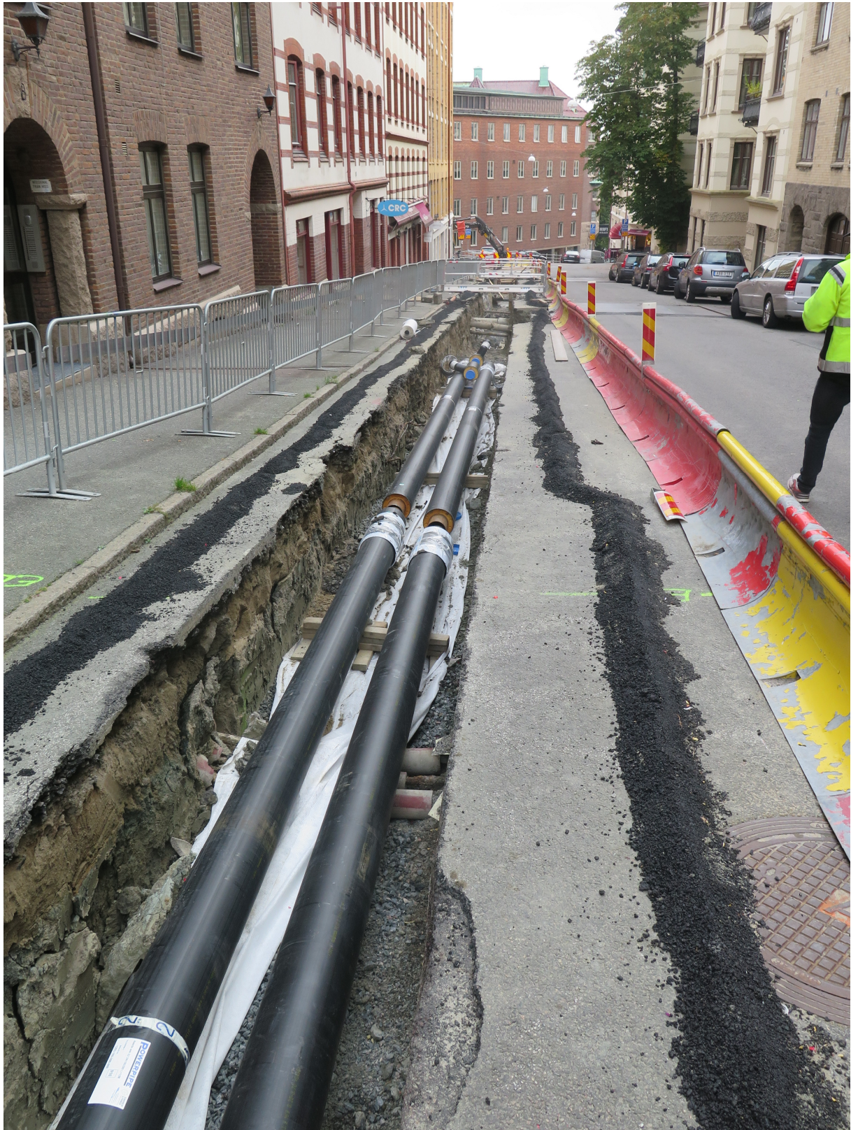
Figur 3. Översikt över Hvitfeldstgatan mot öster med de nya fjärrvärmeledningarna nedlagda i schaktet. Denna del grävdes utan antikvarisk närvaro för vilket ansvaret för misstaget ligger på beställaren.