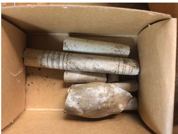
Figur 10. Kritpipor från lager 3 grovt daterade till 1600-talets andra hälft.