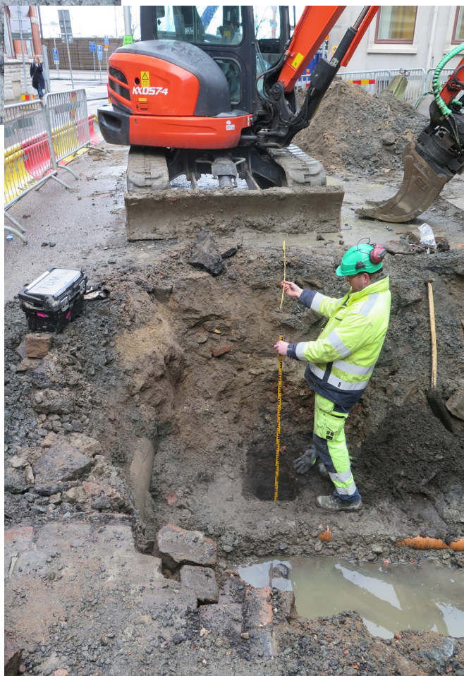
Figur 7. Provschaktet grävdes i lednings-schaktets sydvästra del, mot väster.