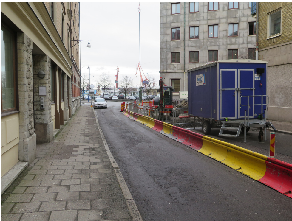
Figur 3. Översikt över Postgatan mot väster. Undersökningsschaktet är beläget bakom manskapsboden.