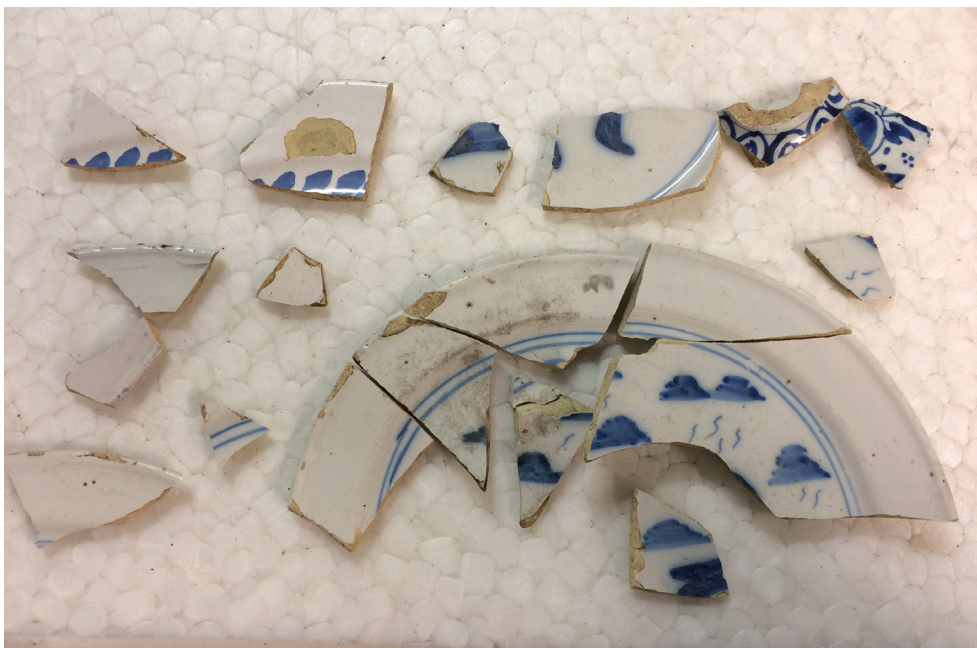
Figur 8. I provschaktet framkom holländsk fajans, bland annat denna tallrik som bör dateras till sent 1600-tal/tidigt 1700-tal.