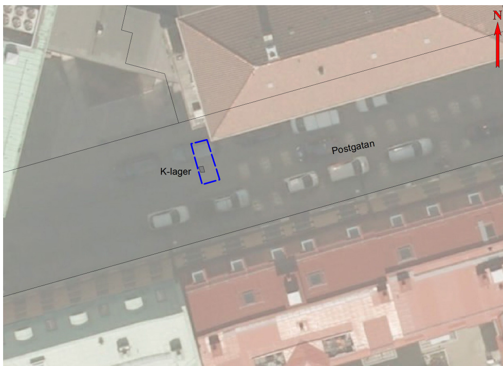
Figur 4. Undersökningsområdet på ortofoto med den del av kulturlagret som undersöktes markerat i grått.