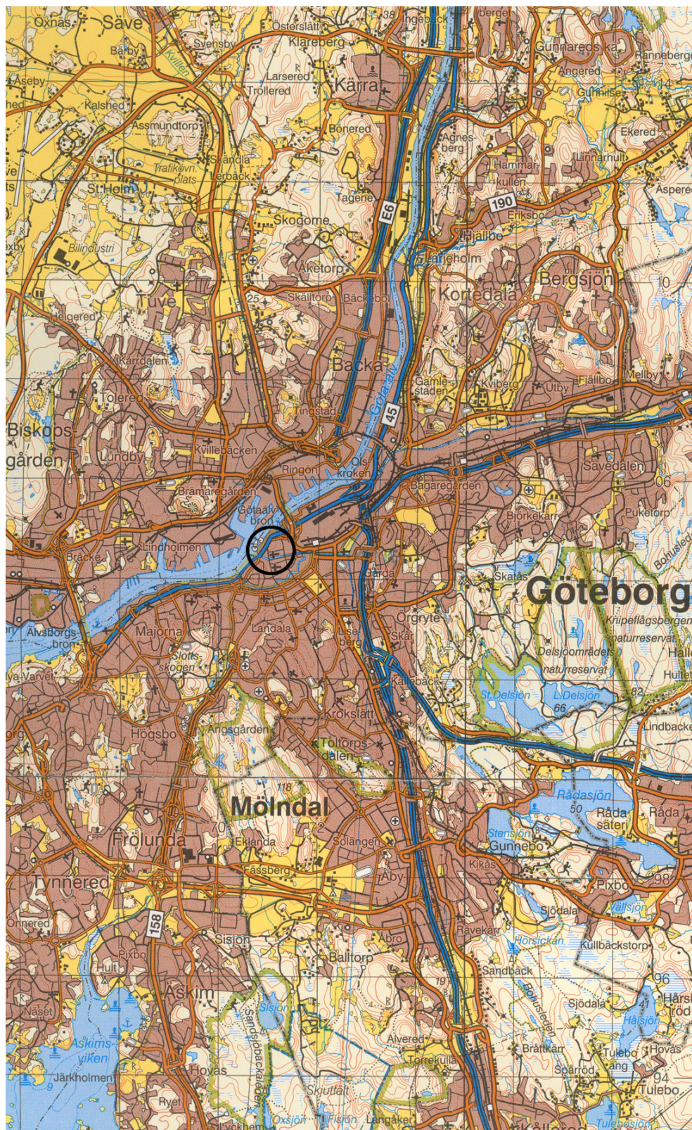
Figur 1. Karta över centrala Göteborg för orientering. Ringen markerar platsen för undersökningen. Blå kartan, skala 1:100 000.