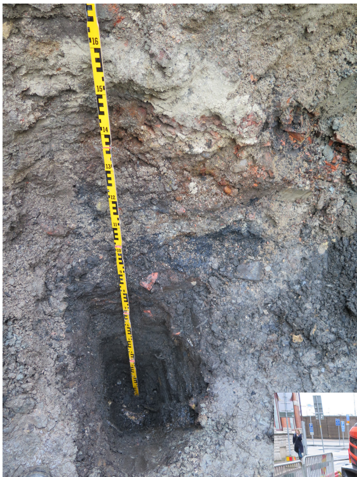
Figur 6. Ett provschakt grävdes med spade för att utreda kulturlagrets mäktighet. Kulturlagret försätter minst ytterligare 0,3 meter under schaktbotten. Mot väster.