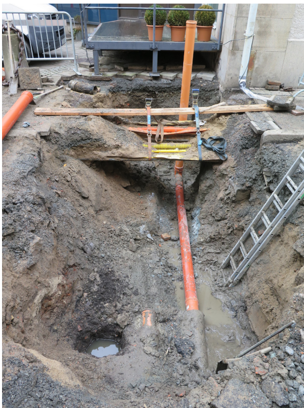
Figur 5. Ledningsschaktet, mot norr. I bildens framkant syns den grävda provgroppen i vars överkant kulturlagret anas.