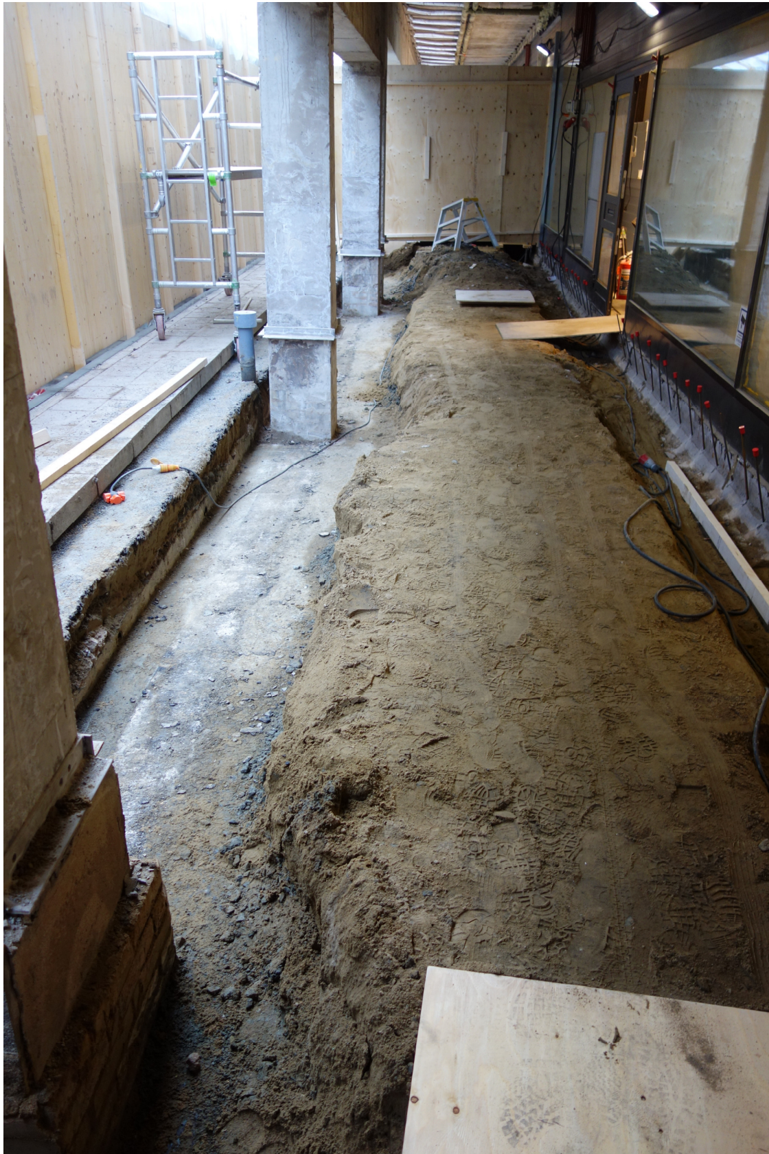
Figur 2. Aktuell undersökningsyta mot väster. På bilden syns betongbalk till befintlig byggnad tydligt. Det schaktades inte djupare i samband med exploateringen.