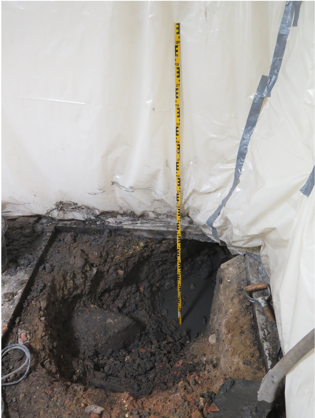
Figur 4. Översikt över schakt 2 där raseringsmassorna under nuvarande golv syns tydligt. Ett större stenblock tittar fram ur massorna men frånvaron av kalkbruk gör att det sannolikt inte ingår i befästningslämningen. Det är troligen en löst liggande sten i fyllnadsmassorna. Foto mot öster.