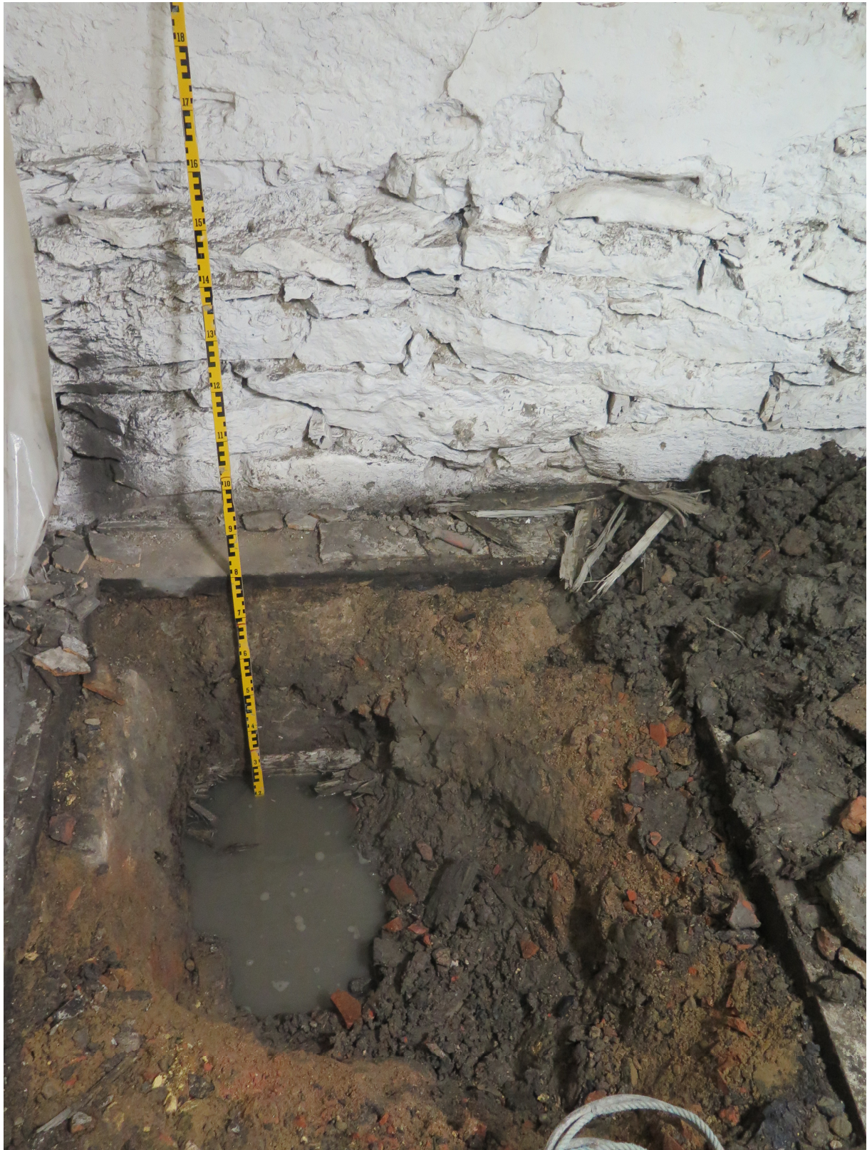
Figur 3. Översikt över schakt 1 där raseringsmassorna under nuvarande golv syns tydligt. Vid måttstockens bas syns rustbädd till befintlig byggnad. Foto mot väster.