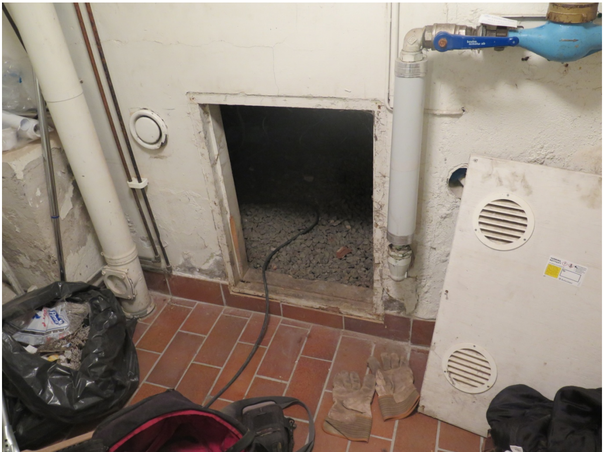
Fig. 3. Ingången till källarutrymmet.