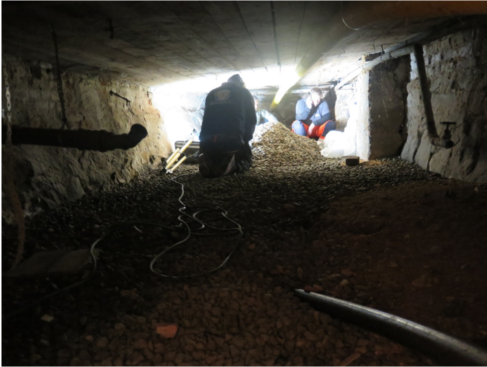
Fig. 4. Källarutrymmet där den antikvariska kontrollen gjordes.