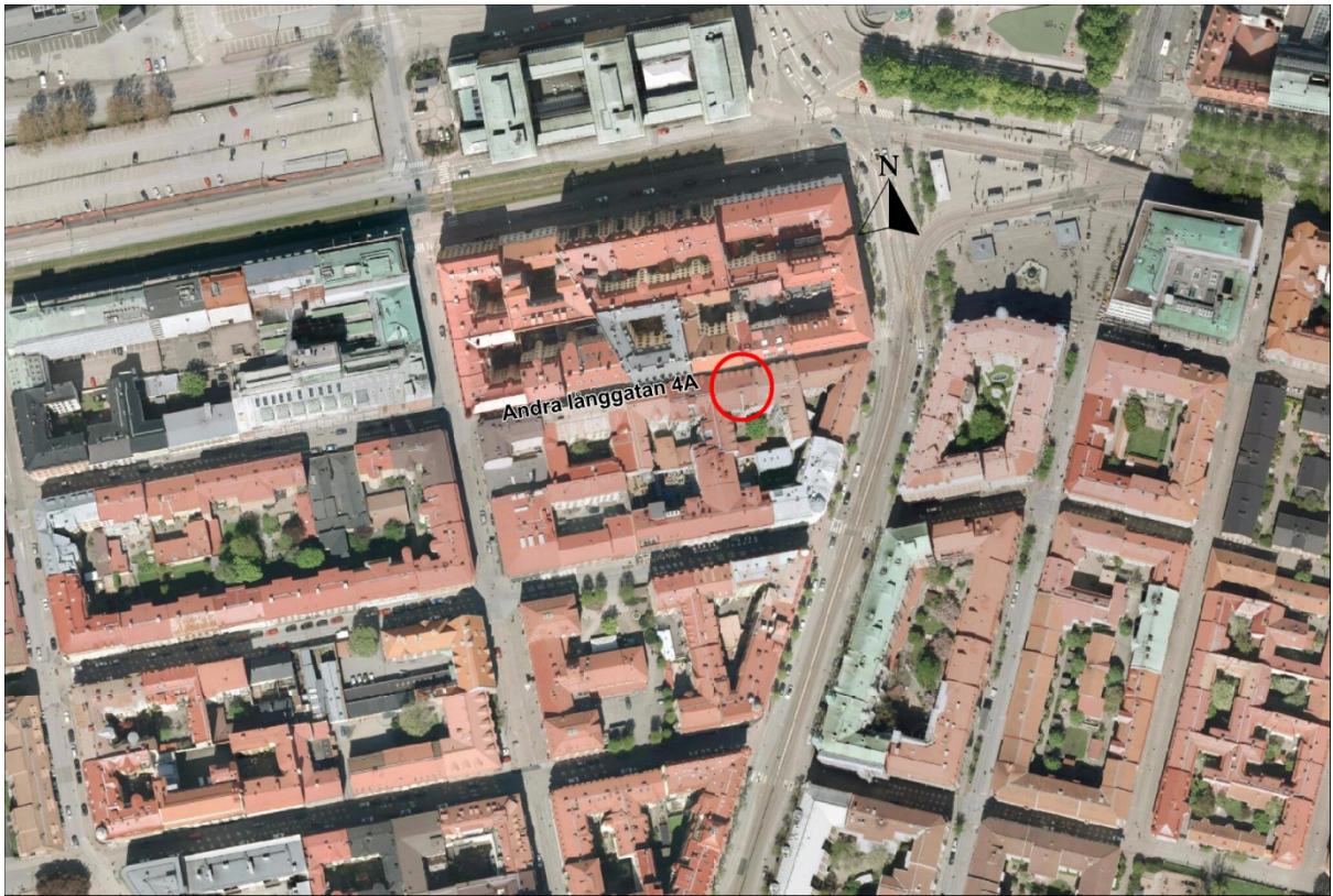
Fig. 2. Platsens läge på Andra Långgatan i Göteborg.