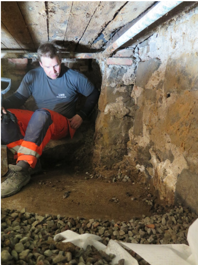
Fig. 5. Platsen där provrutan grävdes.