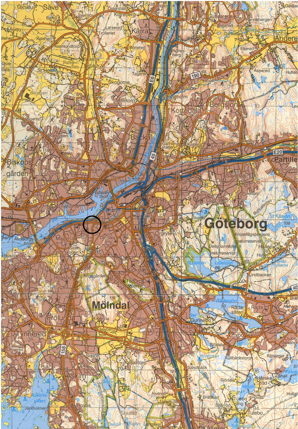
Fig. 1. Undersökningens plats markerad med cirkel på Blå kartan, skala 1:100 000.