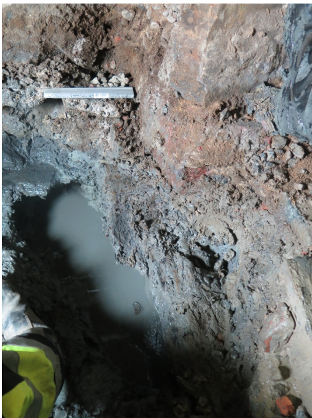
Fig. 7. Rester av rustbädd ses direkt till höger om vattensamlingen på bilden. I övre vänstra delen av bilden ses en träplanka. Hållrummet har framför allt varit fyllt med sten.