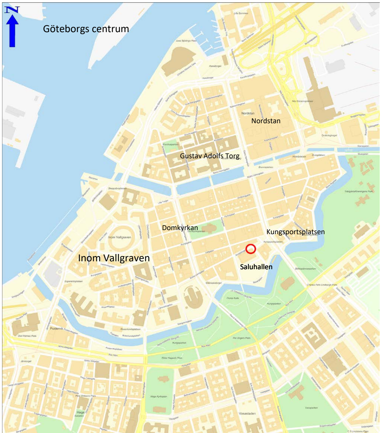
Figur 2. Karta som visar Göteborgs centrala delar samt platsen för schaktningsövervakningen vid Saluhallen markerad med röd ring.