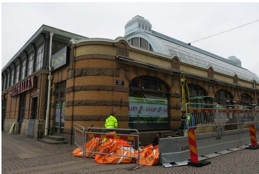
Figur 4. Schaktets läge vid nordöstra hörnet av Saluhallen mot gatan Kungstorget. Åt väster ansluter Södra Larmgatan.