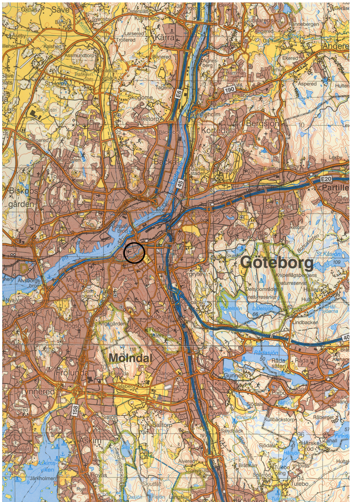
Figur 1. Undersökningens plats markerad med cirkel på Blå kartan, skala 1:100 000.