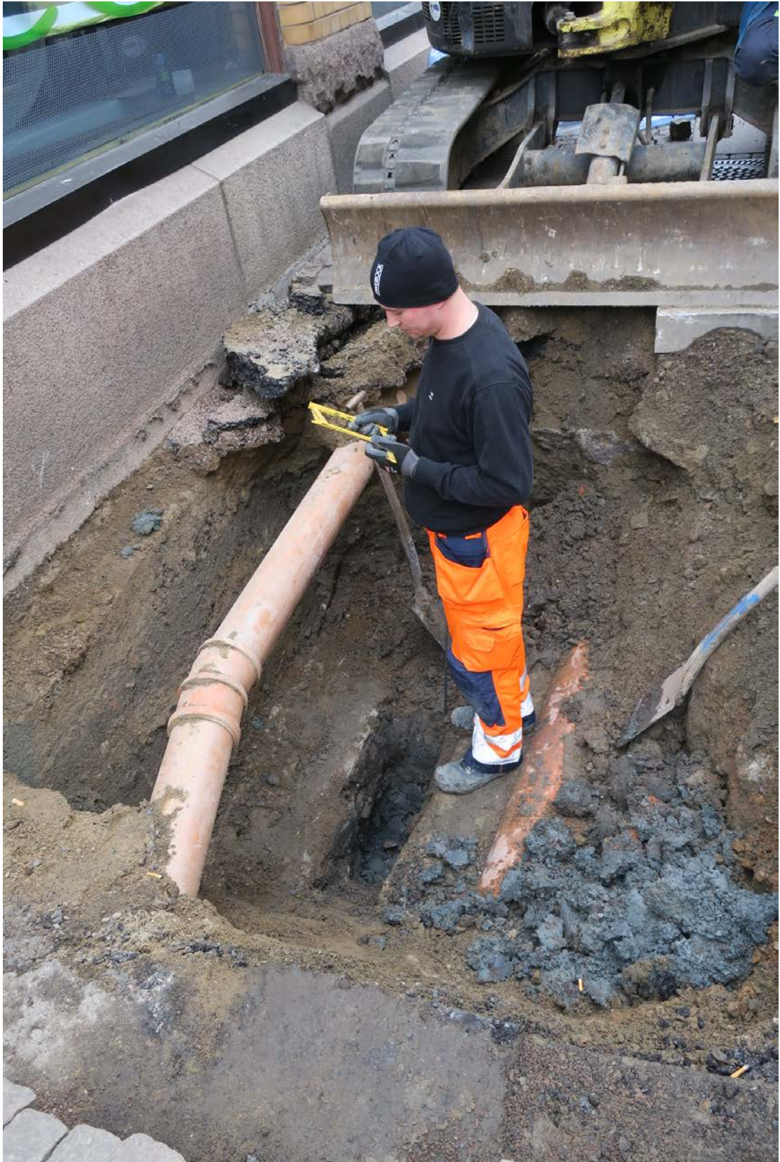
Figur 5. I schaktet fanns endast recenta fyllnadsmassor samt rör för dagvatten och fjärrvärme. En betongklack i botten av schaktet forcerades och under denna framkom omrörd lera och en träpåle. Enstaka föremål av 1700-1800-tals karaktär hittades i omrörda lager närmast husväggen. Dessa omhändertogs inte. Materialet tolkas komma från omflyttade kulturlager.