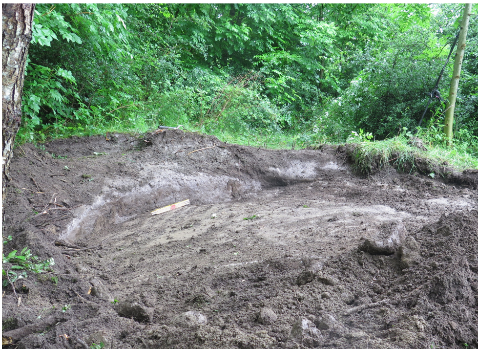
Figur 8. En del av den höglignande bildningen visade sig vara en naturlig bergskant.