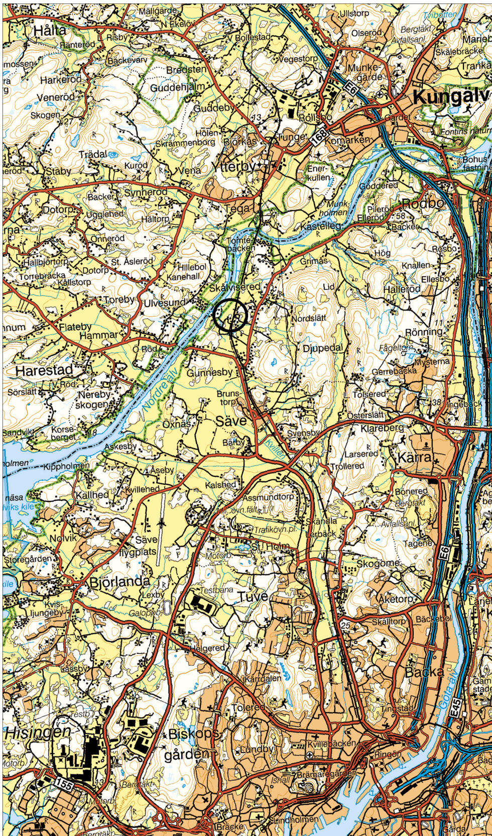
Figur 1. Utredningsobjektets läge på norra Hisingen. Vägkartan, skala 1:100 000.