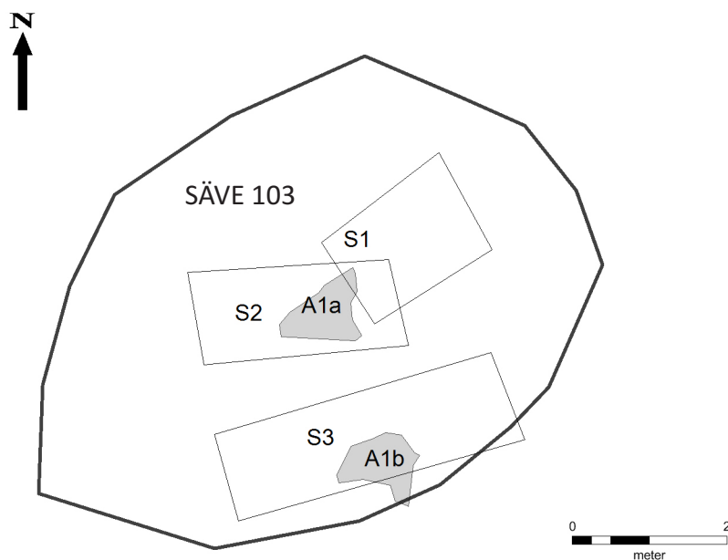
Figur 4. Schakt- och anläggningsplan.

0,35- Gul lerig silt. Därunder berg. I västra änden av schaktet en sotig mörkfärgning, cirka 0,2 m i diameter. Den genomgrävdes men kunde inte tolkas närmare. I en svacka i berget ligger en stenpackning (A1b), cirka 1,2 x 0,8 m stor. Stenarna är cirka 0,2 m i diameter, med en större sten cirka 0,45 x 0,30 m stor. Inga fynd.