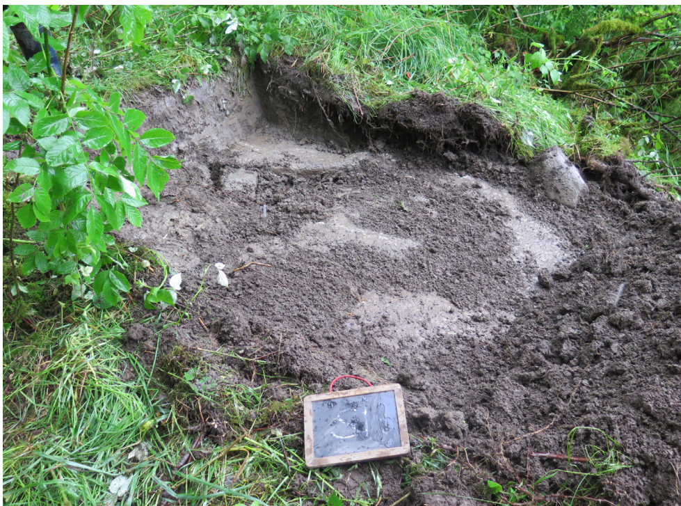
Figur 5. Schakt S1. I bildens högra sida syns berget direkt under matjorden. Foto mot väst.