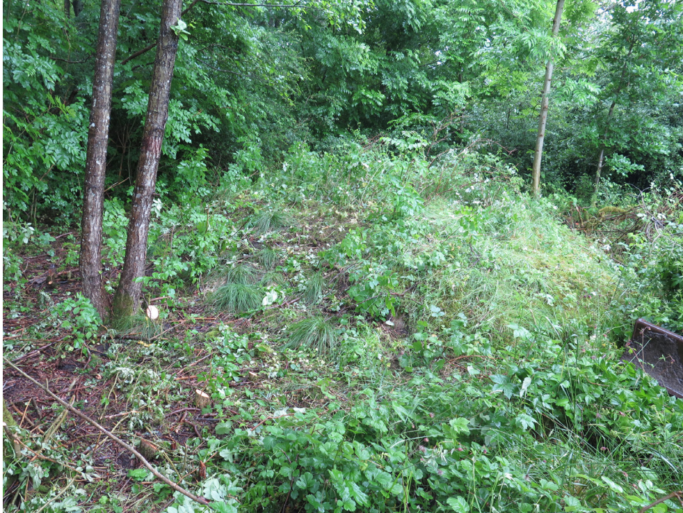
Figur 3. Den höglignande lämningen före undersökning.