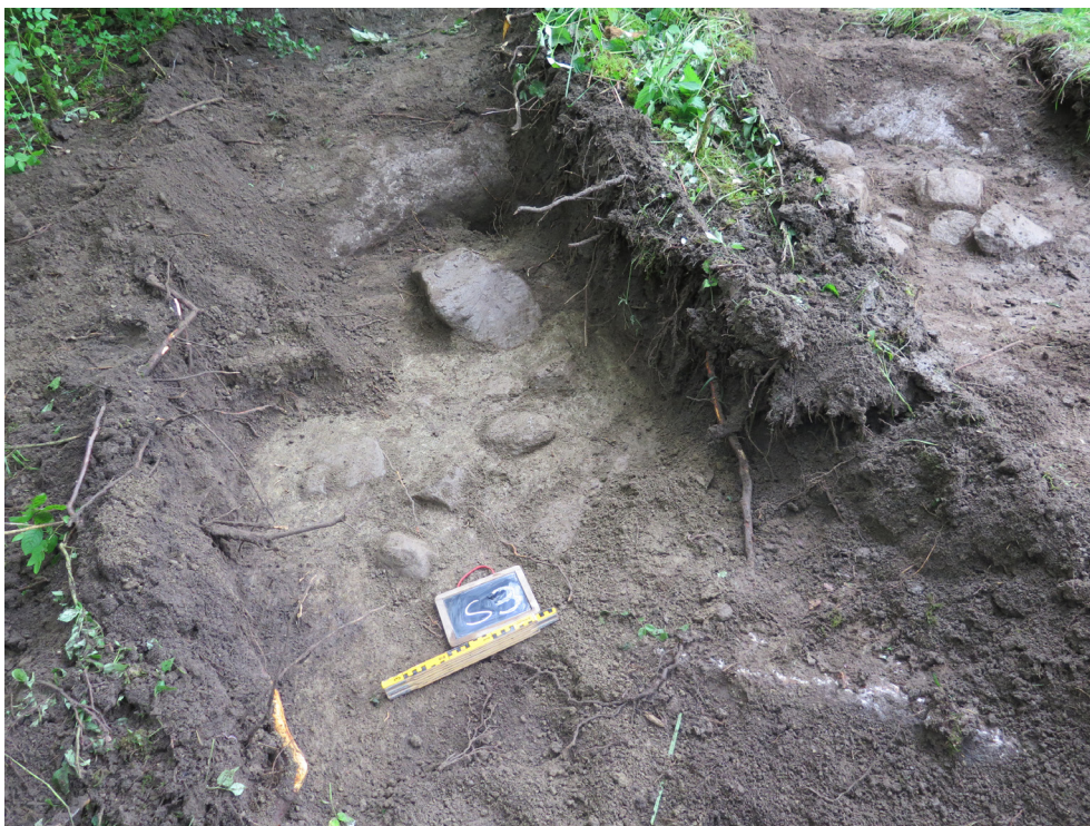
Figur 7. Schakt S3 med den glesa stenpackningen A1b. Bakom denna är en bergskant synlig. I bildens högra övre hörn syns även S2 med stenpackningen A1a. Foto mot väst.