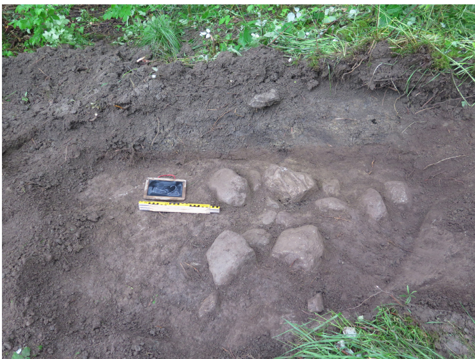
Figur 6. Schakt S2 med stenpackningen A1a. Ovanför det naturliga siltlagret med stenarna syns den påförda, lerblandade matjorden. Foto mot söder.