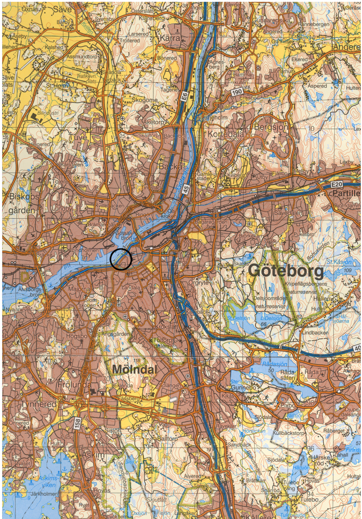
Figur 1. Översikt över centrala Göteborg med undersökningsområdet markerat, skala 1:100 000.